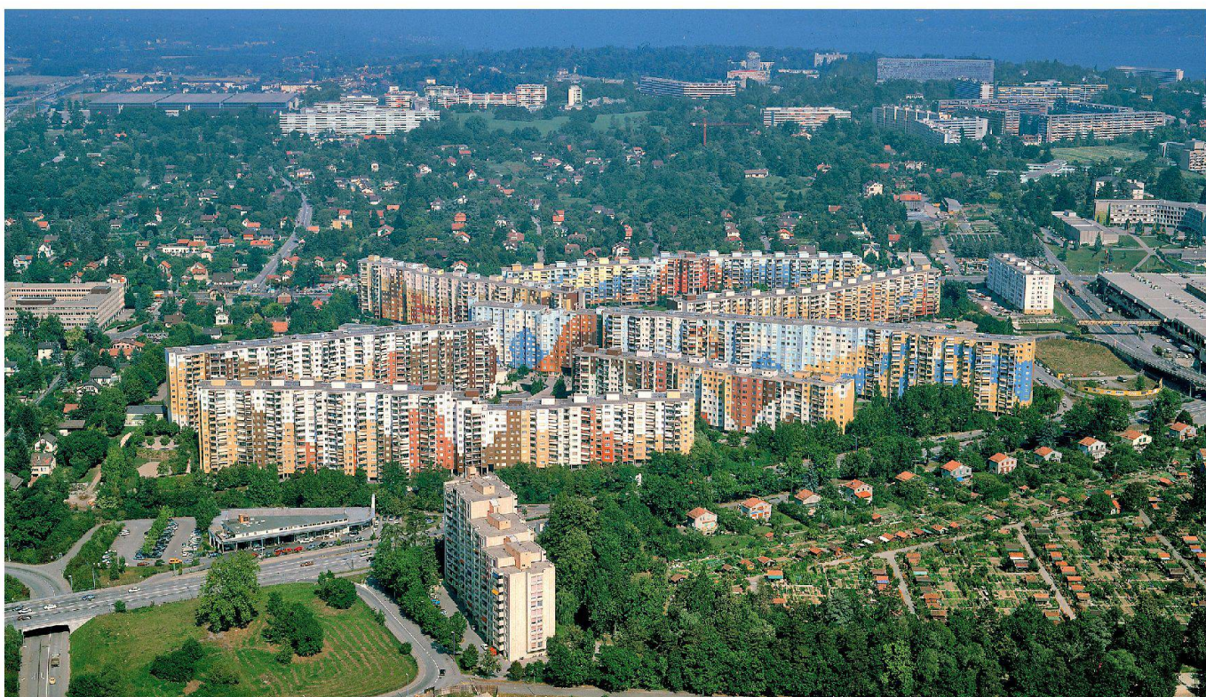
La cité des Avanchets à Vernier (GE) (1971–1977), Steiger et Partner, Walter Maria Förderer, Franz Amrhein (photo: Dieter Enz, 1985)