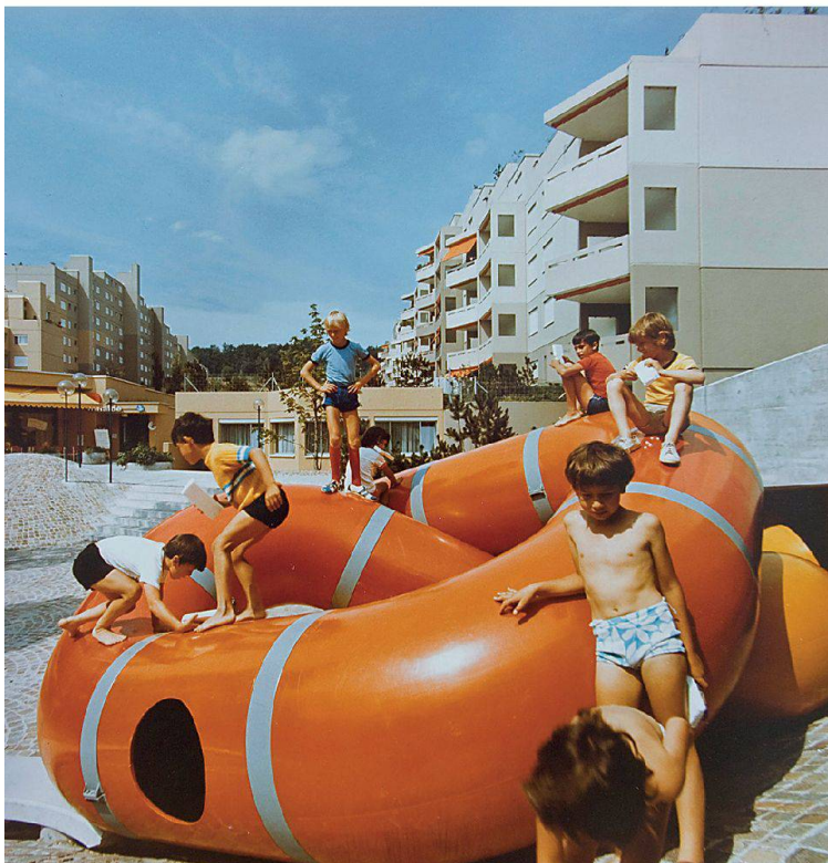
Spielplatz der Göhner-Siedlung Sonnhalde Adlikon ZH um 1970 Place de jeux de la cité Göhner de Sonnhalde à Adlikon (ZH) vers 1970