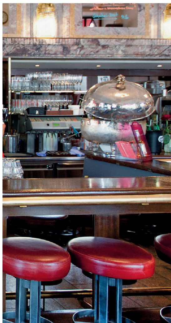
Das geschichtsträchtige Odeon in Zürich Le Café Odéon, un établissement historique à Zurich

Zeitgleich kam in der Schweiz die «Zuckerbäckerei» auf: Kaffee und Süßgebäck waren prädestiniert für den gemeinsamen Verzehr. Konditoreien stellten oft einige Tische zu Verfügung, wo die Gäste die gekauften Süßigkeiten umgehend verspeisen konnten. Dazu wurde Tee, heiße Schokolade und eben Kaffee gereicht. Die wenigen Cafés aus dieser Zeit, die noch bis heute existieren, sind zugleich Konditoreien. Selbst das geschichtsträchtige Odeon in Zürich besaß in seiner Anfangszeit noch eine eigene Backstube. Die Confiserie Schiesser am Basler Marktplatz ist eines der am besten erhaltenen Cafés aus dieser Zeit. Als die Konditorei 1870 am heutigen Standort eröffnete, wurden bereits in der Zunftstube im Obergeschoss Gäste bewirtet.