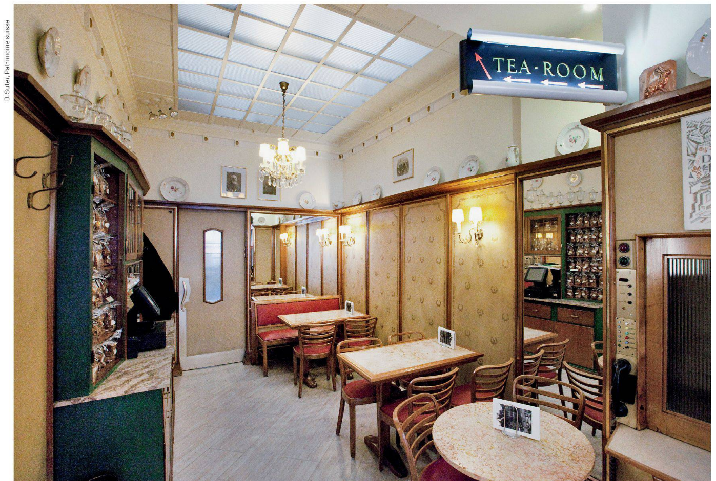
Café du Coin à La Chaux-de-Fonds (en haut) et Confiserie Schiesser à Bâle Café du Coin in La Chaux-de-Fonds (oben) und Confiserie Schiesser in Basel