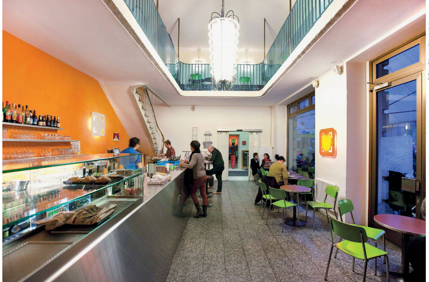
Von der Bank zum Café: «Unternehmen Mitte» in Basel Transformation d'une banque en café: «Unternehmen Mitte» à Bâle

wandeln sich jeweils beinahe unbemerkt vom Café zur Bar, wenn am späteren Nachmittag die Kaffeetassen auf den Tischen verschwinden und allmählich Bier-, Wein- und Cocktailgläser deren Platz einnehmen.