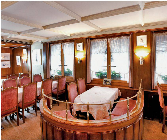
Café Laimbacher à Appenzell Café Laimbacher in Appenzell

et distinguée, qui connut son apogée dans les années 1940 à 1960. Qui aurait oublié l'ambiance feutrée de ces salons de thé typiques aux murs recouverts de tapisseries à fleurs? Les établissements, avec du mobilier rembourré et des plantes vertes, qui proposaient des toasts Hawaï ou des canapés aux asperges ne sont plus à la mode. Souvent, le départ à la retraite de leur tenancier et leur disparition, faute de trouver un successeur, ne sont qu'une question de temps. Les établissements comme le Tea room Métropole de Sierre dont l'aménagement intérieur des années 1960 a été préservé se font de plus en plus rares.