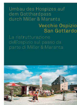
Michael Hanak (Hg.): Vecchio Ospizio San Gottardo: Umbau des Hospizes auf dem Gotthardpass durch Miller & Maranta Park Book, Zürich 2012. Durchgehend zweisprachig d/i, 128 Seiten, CHF 58.–

Nach Fertigstellung des Umbaus 2010 ist das alte Hospiz auf dem Sankt Gotthard in die Liste des europäischen Kulturerbes aufgenommen worden, womit die Bedeutung des Denkmals für die Geschichte und Kultur Europas unterstrichen wird.