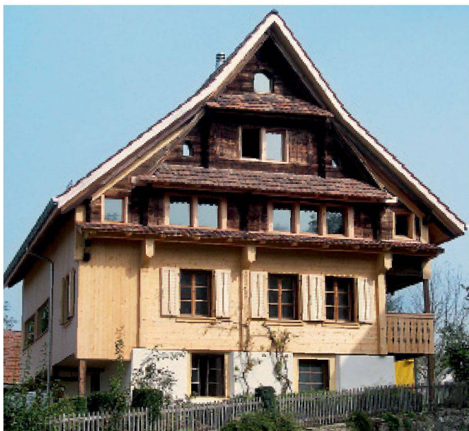
Maison Sagenmatt, Gisikon (LU), rénovation 2007: une île entourée de constructions nouvelles, d'artères de trafic et d'une ligne ferroviaire. (photo Imhof Architekten SA)

La situation de l'objet – éloigné ou proche d'un village urbanisé – joue un rôle important. La limitation effective ou présumée des possibilités de transformer un bâtiment ancien se heurte à un sentiment d'incompréhension lorsque l'objet est situé à l'écart et dans un endroit marqué par l'exode rural. Ces restric-