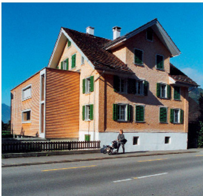
Schürmatt, Stansstad NW, Umbau 2002: Altes, mit Neuem ergänzt, wird zu einem neuen Ganzen. (Bild Imhof Architekten AG)

Ein wichtiger Faktor ist die Lage des Objekts. Steht es abgelegen, oder ist es in der Nähe eines verstädterten Dorfes? Die durch ein altes Gebäude verursachten effektiven oder vermeintlichen Einschränkungen wecken gerade in abgelegenen und von Abwanderung geprägten