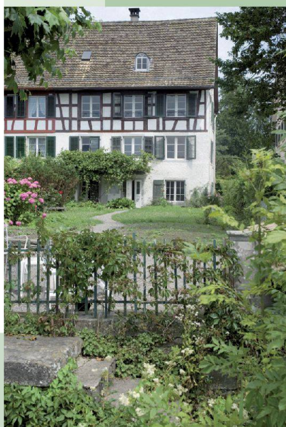
Haus Blumenhalde — Uerikon (ZH)