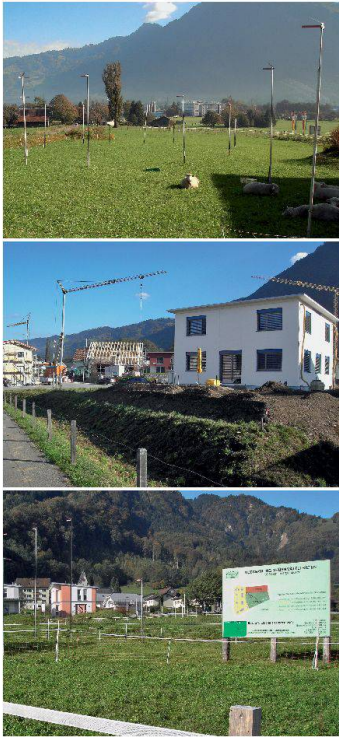
La manière dont le sol est utilisé en Suisse n'est ni durable, ni rationnelle.