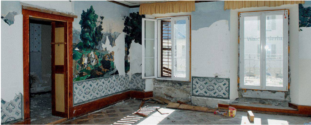
Die Denkmalpflege ist eine Verbundaufgabe zwischen Bund und den Kantonen. Im Bild das Hotel Meyerhof in Hospental.

La protection du patrimoine et des biens culturels est une tâche commune de la Confédération et des cantons. Hôtel Meyerhof, Hospental.