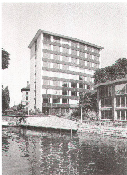
Hochhaus «Zur Bastei», Zürich 1953–55, Werner Stücheli

Avec son stand très original, Patrimoine suisse a présenté sa campagne «L'envol – l'architecture des années 50» à la foire suisse «BAUEN UND MODERNISIEREN» de Zurich. Nombre de curieux sont venus s'informer et se renseigner sur ses activités.