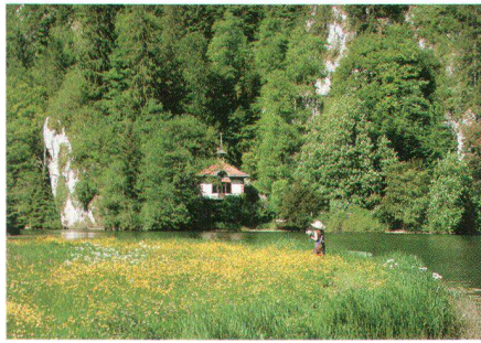
Die «Maison du Sonneur» am Doubs-Ufer La Maison du Sonneur sur les rives du Doubs

De la fin du XIX e siècle à la Première Guerre mondiale, l'activité est intense aux Sonneurs. Les associations, sociétés patriotiques, musicales et sportives s'y succèdent. Les politiques aussi en font leur lieu de réunion pour débattre de grands projets (pont de Biaufond édifié en 1881, pont de la Rasse en 1893, ligne ferroviaire Saint-Hippolyte-La Chaux-de-Fonds qui ne verra jamais le jour!). Le 20 juillet 1880 demeure le jour faste par excellence dans les