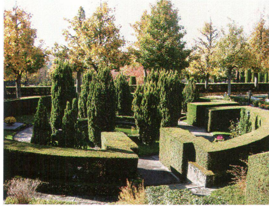
Le cimetière du Bois-de-Vaux allie des éléments de l'architecture paysagère d'inspiration française et italienne

Le cimetière du Bois-de-Vaux est un très beau jardin inscrit à l'inventaire cantonal des monuments et des sites. Considéré dans son ensemble, il nécessite des soins attentifs du Service municipal des Parcs et Promenades. Le développement de la crémation a ralenti le rythme d'utilisation des terrains. Certaines parties du cimetière sont désaffectées et la ville a entrepris des travaux de rénovation visant à réaménager ces secteurs. Le service des parcs et promenades a arraché certaines haies