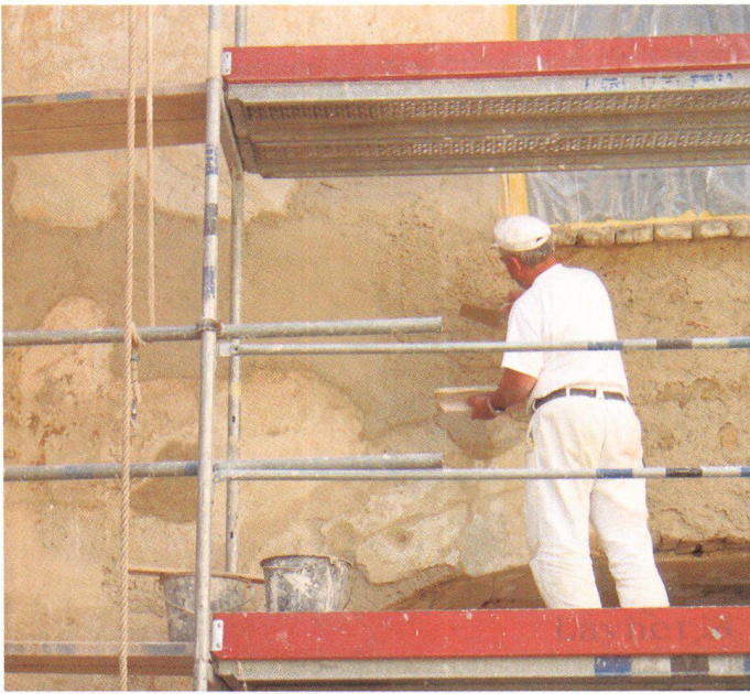
Schliessen beschädigter Fasadenteile mit Kalkverputz im Rahmen eines Grundkurses der Restaurierungswerkstätten in der Kartause Mauerbach/Österreich

Restauration d'une façade endommagée avec du crépi à la chaux dans le cadre d'un cours des ateliers de restauration de la chartreuse de Mauerbach, Autriche