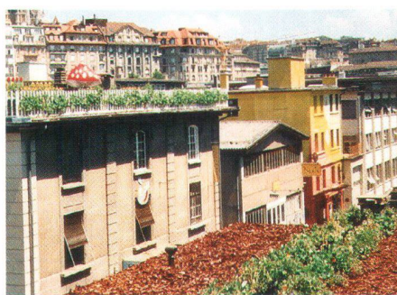
Le prix des jardins 2000 a été attribué à l'association « Jardin urbain » pour l'organisation d'une exposition originale à Lausanne