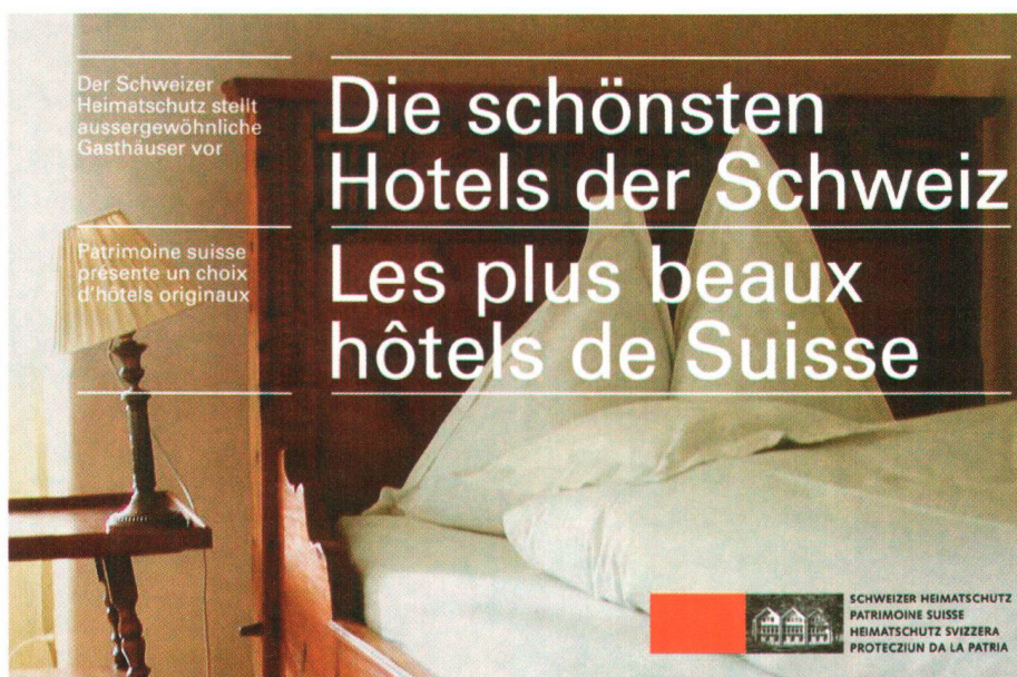
Titelseite des neuen Hotelführers