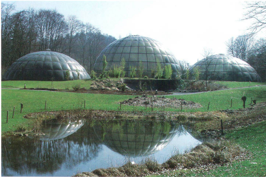
Der Neue Botanische Garten Zürich von 1977 gehört zu den bekanntesten Anlagen Fred Eichers Le nouveau jardin botanique de Zurich (1977) est l'un des parcs les plus réputés de Fred Eicher

Einer der bedeutendsten Landschaftsarchitekten der Schweiz