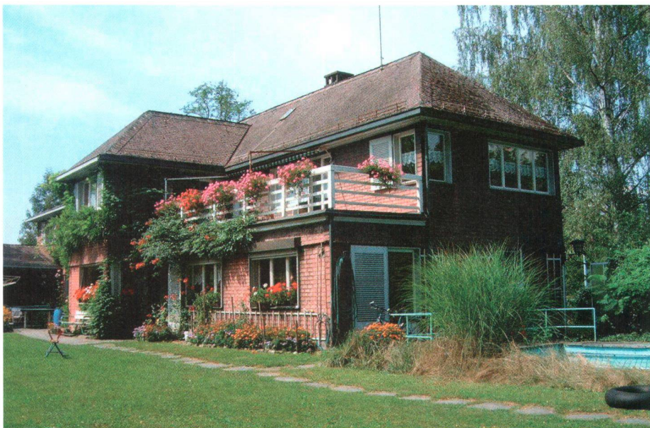
Das SAFFA-Haus wird definitiv von Aarau nach Stäfa ZH verlegt

shs. Anlässlich der Einweihung des Mulino Aino in San Carlo (Puschlav GR) hat der Schweizer Heimatschutz (SHS) den Initianten einen Check von 20'000 Franken für die bemerkenswerte Restauration des ungewöhnlichen, frühindustriellen Handwerkerzentrums übergeben. Zu diesem gehören entlang eines Wasserzufuhrkanals eine Mühle, eine Schmiede, eine Säge und eine Waschanlage. Dank der Associazione pro complesso artigianale preindustriale dal Punt da la Rasiga in Aino konnte diese einmalige Anlage aus dem 19. Jahrhundert gerettet werden. Die Vereinigung restaurierte während zehn Jahren nach und nach die einzelnen Teile des Ensembles.