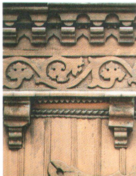
V.o.n.u. Balkonballustraden aus dem Verkaufsalbum der Firma Kaeffer & Cie in Paris; Balkongeländer und Fassadenornamente am Chalet Schafroth im Freilichtmuseum Ballenberg