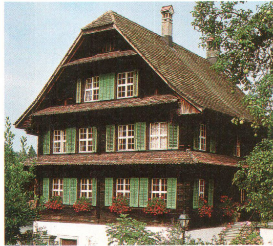
Schlanker, laubenloser Blockbau mit klassizistischer Fassade, erbaut 1705: das Pfarrhaus in Risch

Die weitere Entwicklung des traditionellen Holzbaus betraf nach 1500 vor allem die äussere Form, die Fassadengestaltung (Dekor, Symmetrien, Fensterformen und Farben) sowie das Dach. Im ausgehenden 17. und vor allem im 18. Jahrhundert kam das Zimmerhandwerk zur Blüte, was sich in kunstvoll gestalteten Fassaden und – etwas weniger gut sichtbar – in komplexen Gefügen zeigt. Im Raumkonzept hingegen sind nur geringfügige Änderungen zu beobachten. So befinden sich im Vorderhaus in der Regel eine grössere Stube sowie eine kleinere Nebenstube und dies von ältesten erhaltenen Bauten bis in die 40er-Jahre des 20. Jahr-