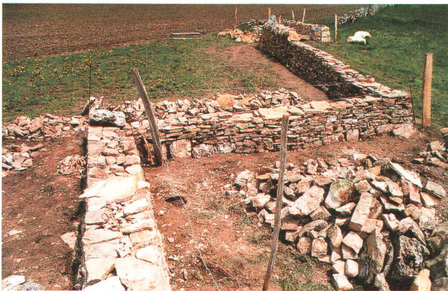
Le Bémont : mur en voie de restauration par la lauréate du prix «Heimatschutz» Eine von der diesjährigen Trägerin des Heimatschutzpreises in Restauration begriffene Mauer in Le Bémont