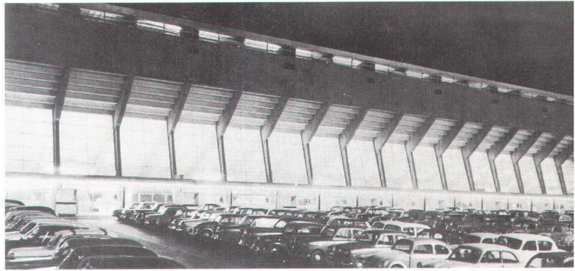
La patinoire des Vernets, dessinée par Albert Cingria, François Maurice, Jean-Pierre Dom et Jean Duret et construite en 1957. Die Eisbahn von Les Vernets wurde von Albert Cingria, François Maurice, Jean-Pierre Dom und Jean Duret entworfen und 1957 erbaut.

térogène, notamment dans la mesure où elle inclut la prise en compte de critères larges faisant référence à des dimensions à la fois traditionalistes et modernistes. Pour mieux connaître ce patrimoine, il est indispensable d'avoir recours à toutes les sources d'information et de documentation disponibles. Cette catégorie de patrimoine répond le plus souvent à des impératifs liés à l'industrialisation et à l'utilisation de nouveaux matériaux. Conserver ce patrimoine consiste donc, pour une bonne part, à disposer au départ d'une base documentaire suffisante. Dans la