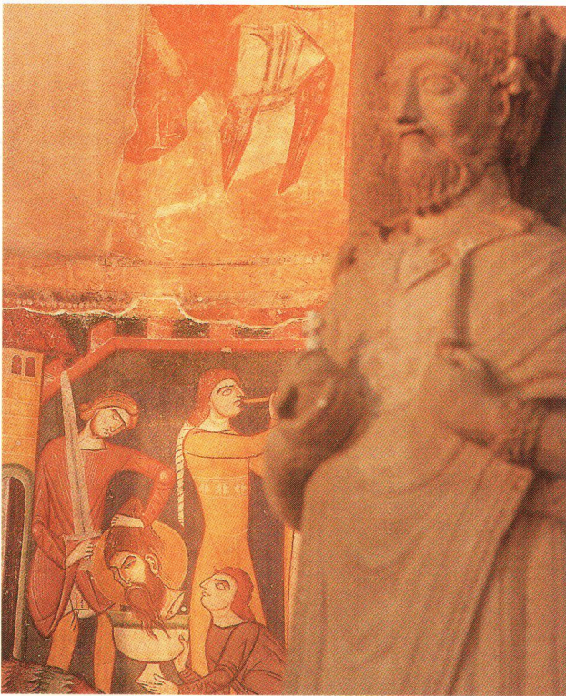
Fresken aus karolingischer Zeit (oben links), die in der Romanik teilweise übermalt wurden (unten links) neben einer Statue.

Fresques carolingiennes (en haut à gauche) en partie recouvertes par des peintures romanes (en bas à gauche) près d'une statue.