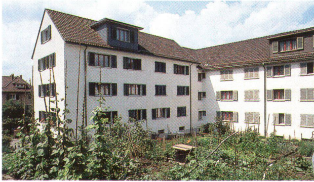
In der Genossenschaftssiedlung Geissenstein sind Wohnmodelle eines ganzen Jahrhunderts vereinigt. La coopérative d'habitation de Geissenstein réunit des modèles typiques de l'évolution du logement au cours de ce siècle.

Gebäude aus der dritten Bauphase aus den sechziger Jahren. Die schnell gebauten Wohnblöcke waren bereits mit akuten Bauschäden behaftet und erforderten eine gründliche Sanierung.