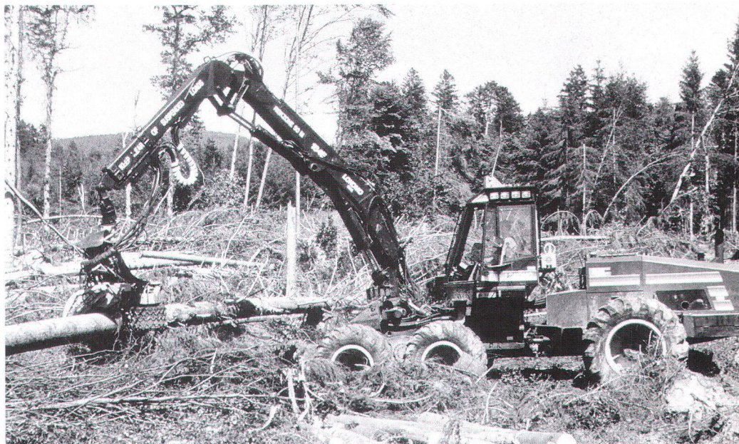
Les simplifications de procédure envisagées dans le cadre des autorisations de défrichage enlèveraient tout pouvoir à l'OFEP. Die geplanten Verfahrensvereinfachungen bei den Rodungsbewilligungen entmachten das Buwal.

simplification des procédures d'autorisation qui visent à englober des procédures jusque là indépendantes, par exemple les autorisations de défricher. De plus, la tendance à attribuer des enveloppes budgétaires pour les subventions fédérales réduit les possibilités de contrôler le respect des exigences fédérales dans la réalisation des projets.