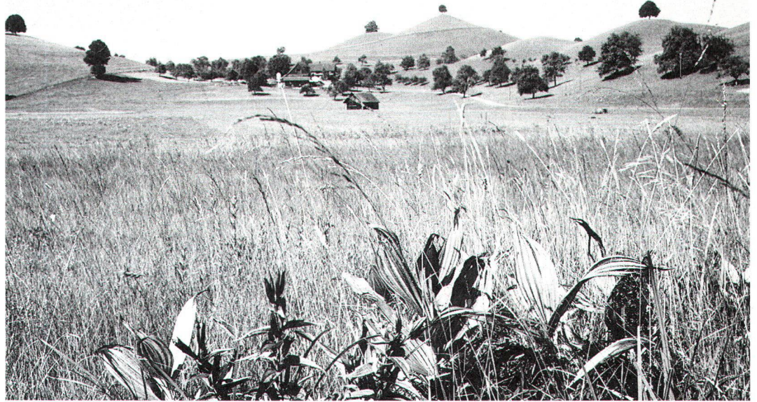
Im neuen Natur- und Heimatschutzgesetz wird den Moorlandschaften besondere Beachtung geschenkt.

Regelmässige, geometrische Anordnungen von Feldern, kanalisierten Gewässern oder Niederstammkulturen empfinden viele Jugendliche als langweilig und öd. Einen hohen Erlebniswert und ein ästhetisch positives Urteil erhalten hingegen abwechslungsreiche, kleinräumige Landschaften, in denen die natürlichen oder naturnahen Elemente dominieren, unregelmässige, nicht schachbrettartige Strukturen vorherrschen und die menschlichen Bauten und Veränderungen sich harmonisch in die Struktur der Landschaft einfügen (z.B. ungeteerte Feldwege oder traditionelle Bauernhäuser). In solchen Landschaften stellen sich bei Jugendlichen auch psychologische Erlebniswerte ein wie romantische Stimmung, Eindruck von Geborgenheit, Wildnis, Lebendigkeit und Frische. Derartige Wunschlandschaften von Jugendlichen sind nun aber in der Schweiz, insbesondere im Mittelland, Mangelware geworden.