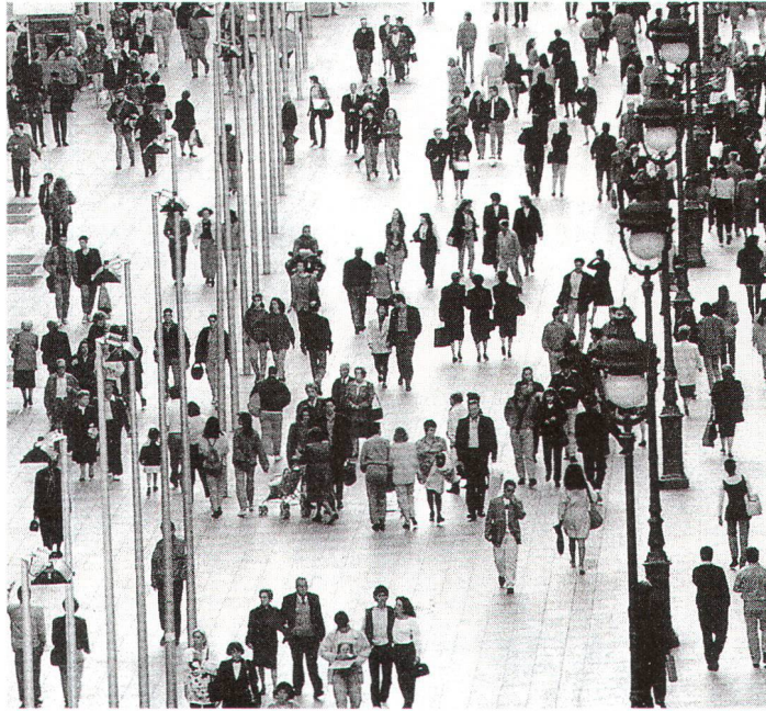
Die Puerta del Angel in Barcelona – ein öffentlicher Raum, der von allen genutzt werden kann und auch wird.

Da gibt es nur ein Problem: Niemand will die Plätze in den Zentren richtig in Besitz nehmen. Und die Stadtbewohner, die gerne möchten, bilden oft