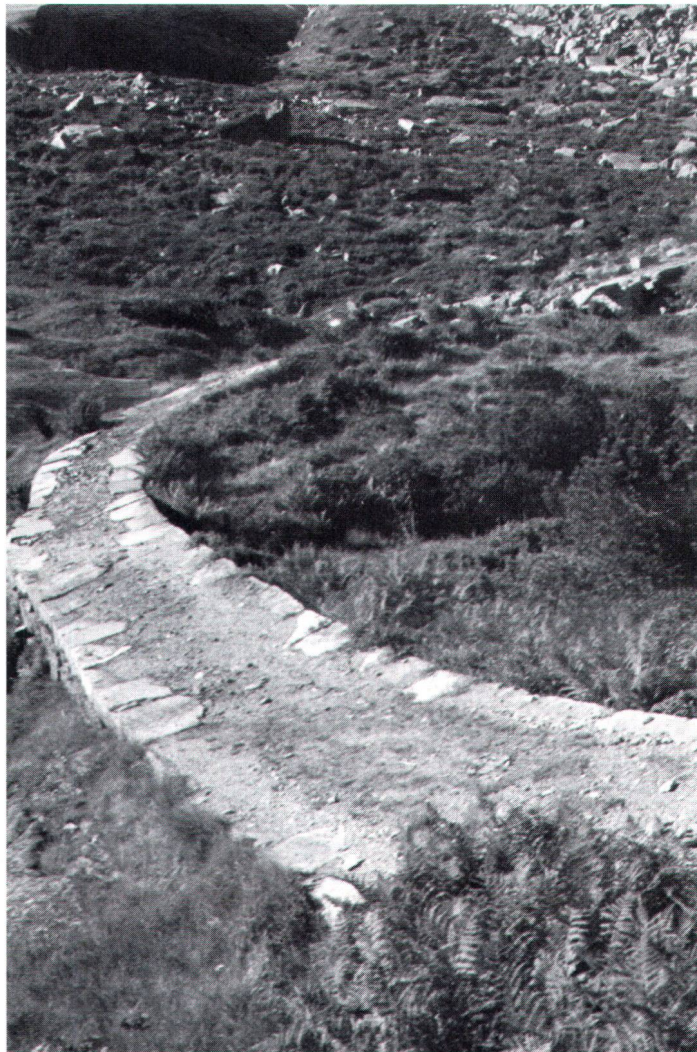
Historische Verkehrswege als Talerhauptobjekt 1993?