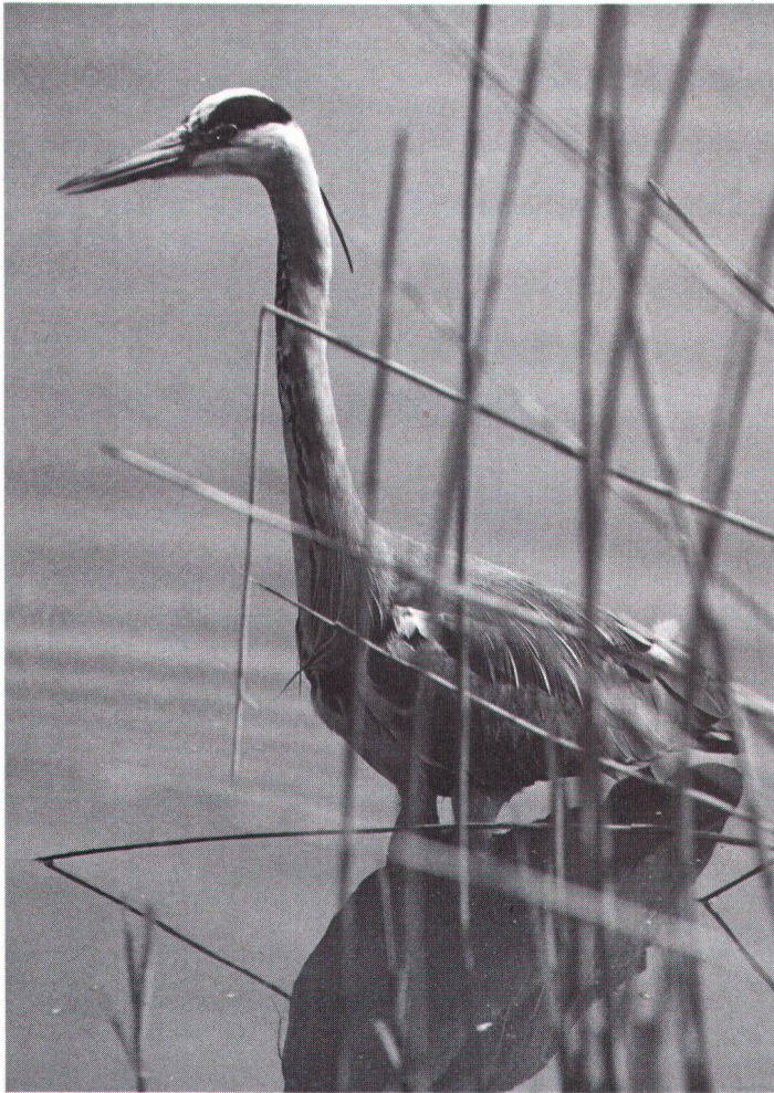
Seeufer bieten vielen Vögeln geeignete Nahrung und Nistorte, so dem Graureiher.

Les rives lacustres offrent à de nombreux oiseaux – comme le héron cendré – la nourriture qui leur convient et des lieux de nidification.