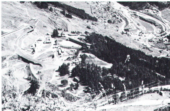
L'«initiative des Alpes» doit protéger les territoires alpestres des conséquences – notamment en matière de constructions – du trafic de transit. Ici, le côté sud du col du St-Gothard et du tunnel.

Gesetze zum Schutze der Natur und Landschaft ein. Da Richtlinien unverbindlich sind, dienen sie nur der Illustration. Sie dürfen folglich keinesfalls an die Stelle von Gesetzen beziehungsweise des Gesetzesvollzuges treten. Eingriffe wie Planierungen, Einrichtung von Schneekanonen, Beseitigung von Bäumen, Hecken und Geländeelementen, Erstellen von Bauten, Skiliften sowie Wegen haben für den Naturhaushalt im empfindlichen hochalpinen Gelände meist sehr schwerwiegende Folgen. Skifahren sollte möglichst bleiben – dazu muss aber nicht die letzte Unebenheit aus der Superbreit-Piste wegplaniert werden!