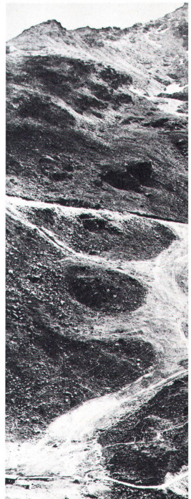
Solche Planierungen, wie sie seinerzeit am Corvatsch durchgeführt wurden, dürfen nach Auffassung des SHS nicht mehr hingenommen werden.

griffe vorgenommen und geduldet. Der SHS tritt aus diesen Gründen vehement für eine konsequente und strenge Handhabung der bestehenden