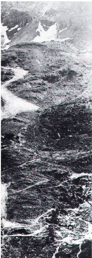
De l'avis de la LSP, de pareils travaux d'aplanissement, tels qu'ils ont été exécutés au Corvatsch, ne peuvent plus être tolérés.

Enfin, le CC a pris connaissance de 13 recours que la LSP a déposés au cours des derniers mois contre divers projets, et a alloué une série de subsides : 2500 fr. pour le projet de film «Mühle Thun», et 55000 fr. pour des restaurations d'édifices dans les cantons du Tessin et des Grisons, et pour des concours de projets dans les cantons de Berne et d'Argovie.