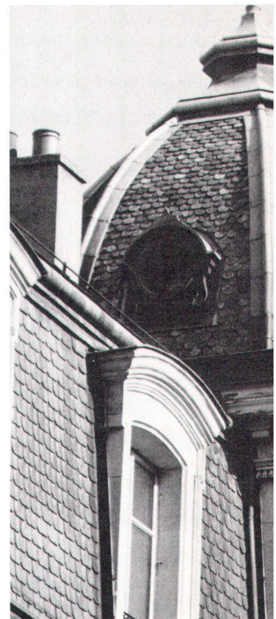
Zu den Fotos auf den Seiten 26 und 27: Die Schiefervielfalt prägt bis heute viele Dorf- und Stadtbilder (Bilder Baertschi).

sie im Durchschnitt dem 26fachen Ertragswert), bestimmen sie immer mehr auch die Übernahmepreise innerhalb der Familien. Als wahrscheinliche Einflussfaktoren stehen sodann das allgemeine Wirtschaftswachstum und die Entwicklung der Baulandpreise im Vordergrund. Für die in den letzten Jahren verschärfte Situation verantwortlich gemacht werden auch agrarpolitische Massnahmen, weil sie grössere Betriebe begünstigen. In einer Querschnittanalyse wurden schliesslich noch die landwirtschaftliche Eignung, die Käuferkategorie und die Region als statistisch signifikante Einflussfaktoren ermittelt. Griffige Verfügungsbeschränkungen für Kulturland mit gesetzlichen Preisgrenzen im bäuerlichen Bodenrecht werden hier als Therapie nahegelegt. Marco Badilatti