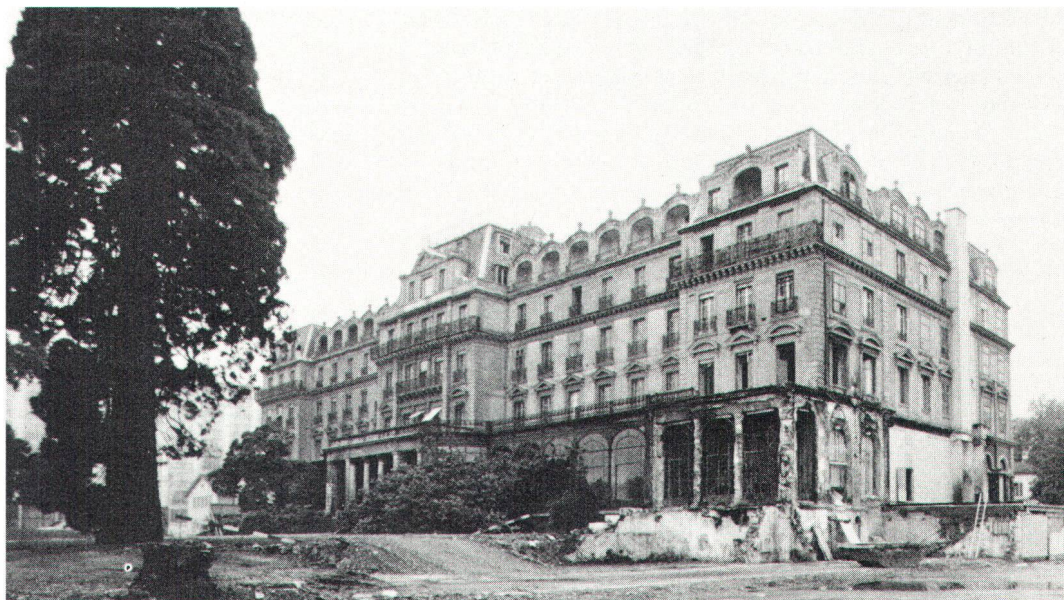
Vue d'ensemble du palais Wilson. Dans le coin de droite, les vestiges du pavillon incendié.

Da eine Rekonstruktion des Pavillons nicht mehr in Frage kommt, ist auch die Diskussion um die Zukunft des Wilson-Palastes wieder aufgeflammt. Heute beherbergt dieser verschiedene Verwaltungslokale der Stadt Genf, welcher das Gebäude gehört. Vor rund einem Jahr hat der Bund Schweizer Architekten einen Ideenwettbewerb veranstaltet, der Möglichkeiten für die zukünftige Benützung des Palastes aufzeigen sollte. Zugleich liess die Stadt die Kosten für eine Renovation des Palastes ermitteln. Weil hier – im Gegensatz zum vor einigen Jahren erneuerten «Metropole» – eine Wiedernutzung als Hotel nicht ins Auge gefasst werden kann, erwägen die Behörden, darin das ethnographische Museum unterzubringen. Touristische Kreise hingegen haben vorgeschlagen, das Gebäude in ein Kongresszentrum zu verwandeln. Ein endgültiger Entscheid steht noch aus. Die Genfer «La rade» hat im Laufe des 19. Jahrhunderts ihr heutiges Gesicht bekommen. So wurden hier 1856 der Hafendamm und 17 Jahre später die «Bains de Pâquis» erbaut. 1931–32 wurde in die «rade» eine Betonkonstruktion eingeflochten, deren Qualität als Zeuge rationalistischer Zwischenkriegsarchitektur besticht. Nun sind die Bäder aber auf Betonpfählen gebaut, die heute zerfallen sind. Ein Wiederaufbauprojekt der