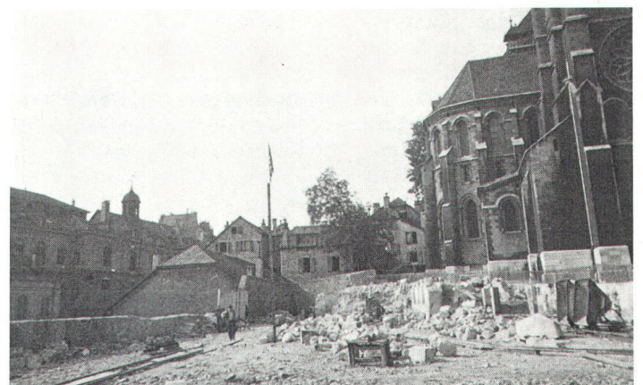
En 1940, un tiers de la vieille ville devait être démoli (photo d'archive).