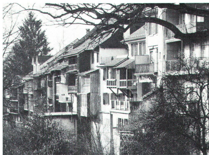
Blick hinter die Altstadtkulisse. Un coin de la vieille ville vue de derrière.