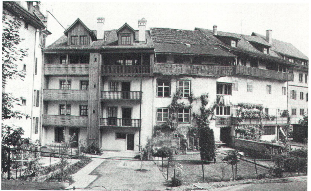
In Bischofszell wird dem Grüngürtel um die Altstadt besondere Beachtung geschenkt. A Bischofszell, on a accordé une attention particulière à la ceinture verte de la vieille ville.

Le cas de Bischofszell est exceptionnel, du fait que ce n'est pas seulement le centre historique qui est protégé, mais aussi les zones qui l'entourent. Telle est la raison essentielle de l'attribution du prix Wakker.