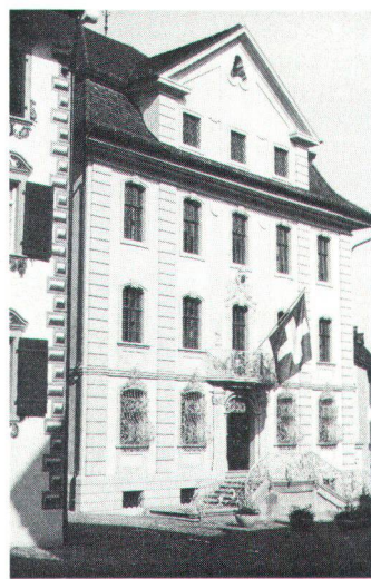
Spätbarocke Fassade des Rathauses von Kaspar Bagnato. Façade de l'hôtel de ville (baroque tardif) de Gaspard Bagnato.