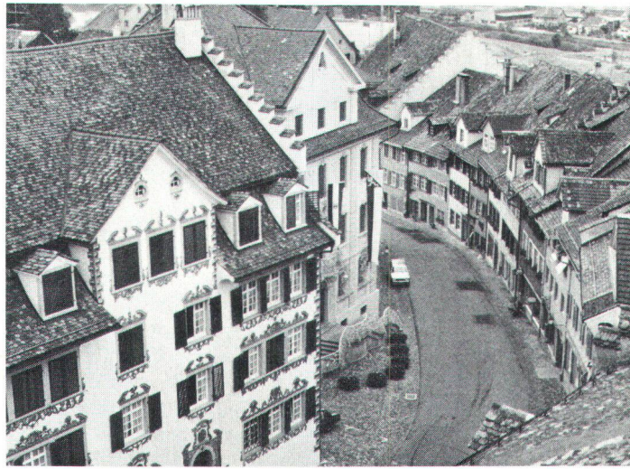
Die Hauptgasse aus der Vogelschau. Vue aérienne de la rue principale.

Anfangs musste allerdings für Renovationen mit den Liegenschafts-Besitzern auf freiwilliger Basis ein Konsens gefun-