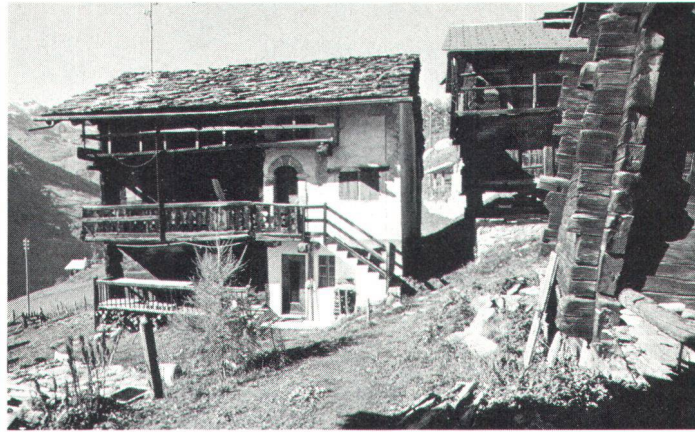
Maison rustique de Villa sur Evolène. Bäuerliches Wohnhaus in Villa bei Evolène (Bilder Schüle).

construction longtemps à l'avance. Les arbres abattus à la forêt puis sciés en poutres séchaient pendant qu'on creusait et construisait la cave. C'est elle qui assurera la conservation du vin, du fromage, des raves, choux et pommes de terre indispensables à la survie de la famille. Complètement enterrée la cave serait trop froide, on la prévoit donc sur la pente; en amont enterrée, elle forme en aval rez-de-chaussée. Ses murs maçonnés serviront de fondations à l'ensemble du bâtiment prévu. Son plafond, voûté ou non, formera le plancher soit de l'étage inférieur de l'habitation, soit d'un étage intermédiaire, en maçonnerie, bas et aux rares ouvertures minuscules, ouvrant sur l'extérieur et nommé «salle». Cet étage sert de dépôt et garde-manger. On y conserve les denrées alimentaires qui ne supportent pas