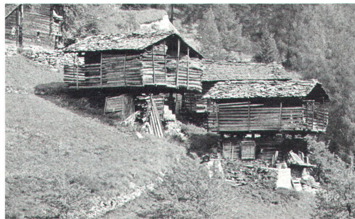
Le raccard abrite les gerbes de céréales. Im Stadel werden die Getreidegarben untergebracht.

l'humidité de la cave, parfois quelques outils, le chanvre, les toiles à foin, etc. Sur la majeure partie de cette cave et de la «salle», on va construire un rectangle ou cube en bois, la pièce de séjour qui sera, dans notre région, faite en gros madriers horizontaux assemblés aux angles. A l'origine, les dimensions de cette «chambre» étaient conditionnées par la longueur des poutres disponibles. Seule la façade en aval ou tournée vers le soleil était percée de fenêtres. Toutes les poutres nécessaires, soigneusement équarries et entaillées pour l'assemblage, étaient préparées avant qu'on ne monte, rang par rang, les quatre parois. Au fur et à mesure qu'on avançait dans le travail, on garnissait la surface supérieure de chaque madrier d'une couche de mousse bien sèche destinée à assurer une parfaite isolation.