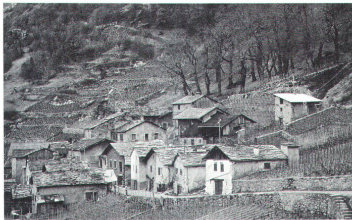
Le mazot, petit logis temporaire (vignoble de Branson).

mille, pour un jeune couple par exemple, on évitait de construire un nouveau bâtiment mais on rehaussait la maison d'un, voire de deux étages, en construisant avec la même technique chambre et cuisine. L'accès se faisait toujours par l'extérieur par les galeries, sorte de balcons longeant les façades gouttereaux et reliées au sol par un escalier. Ces galeries, comme toute chose dans la construction valaisanne, avaient une fonction purement utilitaire: elles étaient utilisées comme sé-