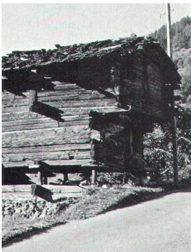
Pour loger le grain, la viande séchée, le pain, etc.: grenier à St-Jean.

Dient der Lagerung von Korn, Trockenfleisch, Brot usw.: Speicher in St-Jean.