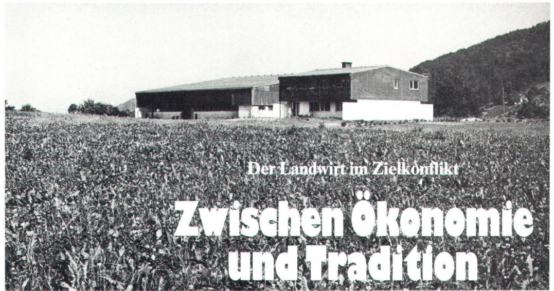
Der Landwirt im Zielkonflikt

Enfin, n'oublions pas de mentionner le «mazot». Situé dans le vignoble, ce petit bâtiment en maçonnerie ou en bois, parfois de construction mixte, n'est, selon les nécessités de son propriétaire, qu'un abri, une petite cave avec ou sans pressoir ou une petite habitation temporaire. Pour les propriétaires venant des villages d'altitude, le mazot permettait de séjourner dans le vignoble pendant les travaux de la vigne et les vendanges. Les Salvaniens, les Bagnards et les Anniards, par exemple, y pressaient le raisin et vinifiaient sur place; d'autres comme les Lensards et les Hérensards préféraient transporter la vendange au village. Voilà la