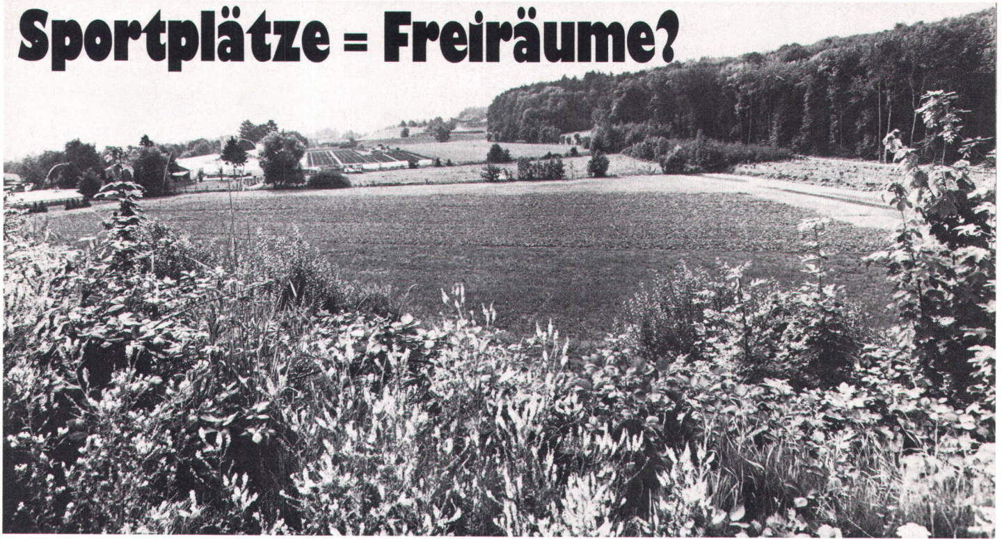
Hier, in einem ihrer letzten Freiräume, will die Stadt Zürich eine neue Sportanlage bauen C'est ici, dans un de ses derniers espaces verts, que la Ville de Zurich veut construire un nouveau centre de sport.