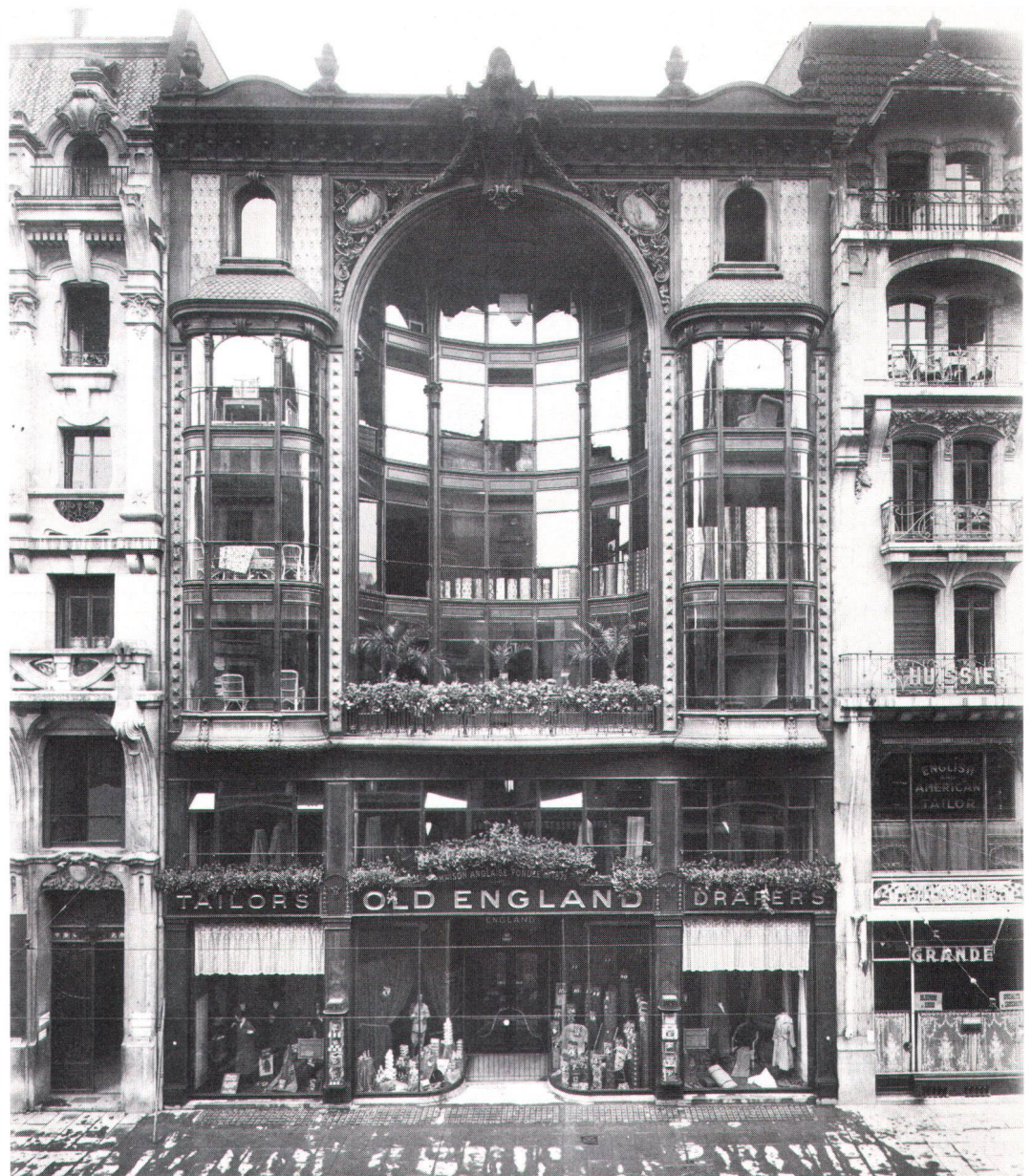
La façade originelle de l'UNIP, à Genève, à la riche ornementation de zinc

Au XV e siècle, par exemple, on travaillait déjà la tôle dans