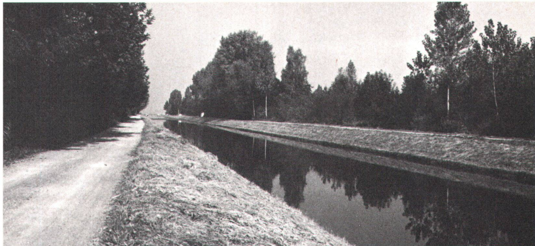
Les corrections riveraines inévitables doivent se limiter au strict nécessaire et ménager le paysage. Unumgängliche Ufersanierungen sind schonend durchzuführen und auf das Nötigste zu beschränken (Archivbild SHS: Rhonemündungsgebiet Les Grangettes VD).

rischen Nutzung» der Wasservorkommen und zur «Berücksichtigung der gesamten Wasserwirtschaft» verpflichtet. Er verlangt ferner Bestimmungen über «den Schutz der ober- und unterirdischen Gewässer gegen Verunreinigungen und die Sicherung angemessener Restwassermengen». Eine vom Eidgenössischen Verkehrs- und Energiewirtschaftsdepartement eingesetzte Arbeitsgruppe unter dem Vorsitz von alt Nationalrat Erwin Akeret legte deshalb im Herbst 1982 einen interdepartementalen Schlussbericht mit konkreten Empfehlungen zur Lösung des Restwasserproblems vor. Dieser erhellt die Anforderungen an die Restwassermengen aus der Sicht der Fischerei, der Ökologie, des Natur- und Heimatschutzes, der Abwasserbelastung, der Erhaltung der Grundwasservorkommen, der Landwirtschaft und der Raumplanung. Bezüglich der umweltschützerischen Anliegen postuliert der Bericht, dass die natürlichen und naturnahen Fließgewässer unbedingt zu erhalten und vor einer Übernutzung zu schützen sind. Er verlangt gesetzliche Vorschriften, um ihre Nutzung zu beschränken und die Mindestabflussmenge zu sichern. Im Blick auf hängige Konzessionserneuerungen werden aber auch Verbesserungen und Ersatzmassnahmen in allen jenen Fällen gefordert, wo bisher auf die Restwasserführung zu wenig geachtet wurde. In jedem Falle erheische die Regelung der Restwassermenge in Zukunft eine Gesamtbetrachtung und eine sorgfältige Interessenabwägung.