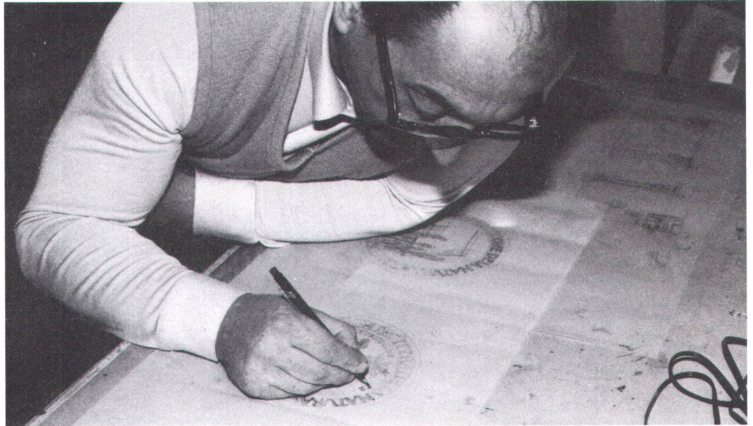
Die Schoggitalerhülle entsteht auf dem Reissbrett. L'habit doré des écus de chocolat naît sur une planche à dessin.

Wer sich ausführlicher über diesen Problembereich informieren möchte, kann beim SBN, Postfach 73, 4020 Basel, das interessante Sonderheft «Unkraut» zum Preise von Fr. 2.– bestellen. Peter Keller