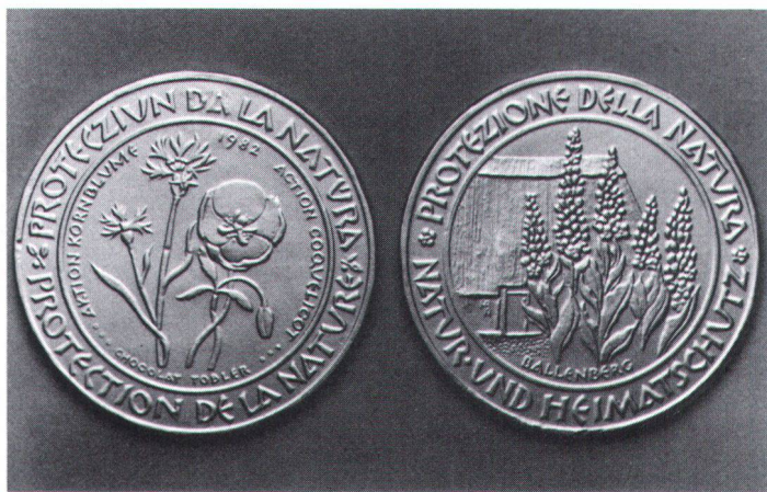
Der Schoggitaler 1982 mit Kornblume, Mohn (links) und Königskerzen (rechts).

L'écu 1982 présente un coquelicot et des bleuets (à gauche), et sur l'autre face des molènes.