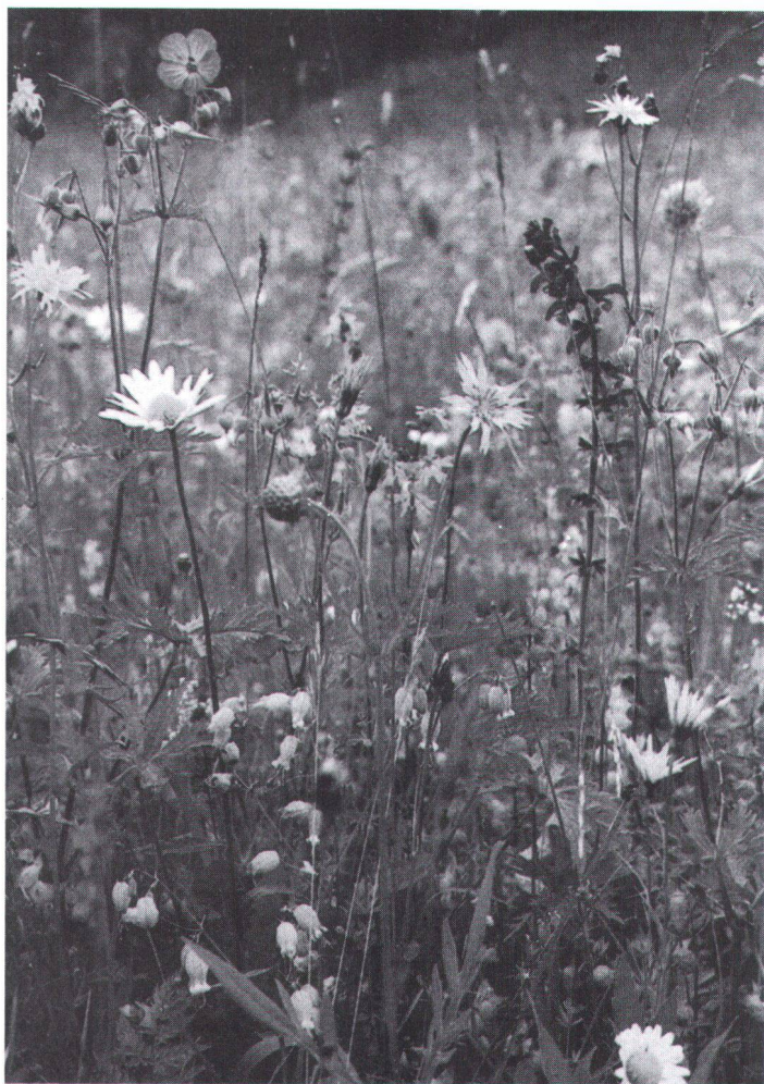
Zahlreiche Pflanzen, die noch vor wenigen Jahrzehnten in Getreidefeldern, Weinbergen, an Wegrändern und auf Schuttflächen anzutreffen waren, sind heute vom Aussterben bedroht.

kann nicht übersehen werden. Von der unbeliebten Brennessel etwa hängt das Überleben von nicht weniger als 25 Schmetterlingsarten ab, weil deren Raupen auf diese Nahrungspflanze spezialisiert sind. Und nicht zuletzt sollten wir die ästhetische Vielfalt unserer Landschaft im Auge behalten: die biologische Artenvielfalt bedeutet ebenfalls eine Bereicherung des sich zusehends monotoner präsentierenden Landschaftsbildes in der Schweiz. Und dennoch: Mit wahren Arsenalen an Maschinen und Spritzmitteln, mit Asphalt und pflegeleichtem Siedlungsgrün führen wir einen unerbittlichen «Krieg» gegen das «Un-Kraut».