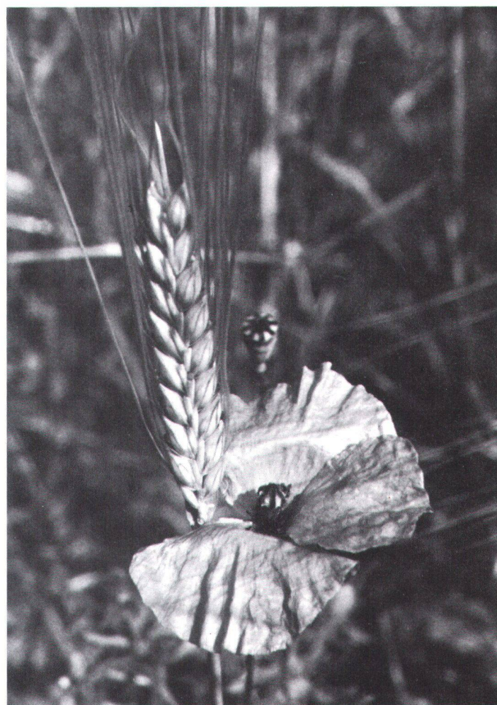
Der diesjährige Talerverkauf «Aktion Kornblume» will dem weiteren Rückgang der als Unkräuter betitelten Blumen – wie Kornblume, Feuermohn, Kornrade, Venusspiegel, Adonis und Feldrittersporn – entgegenzutreten.

De nombreuses plantes qui, il y a quelques décennies encore, égayaient les champs de céréales, les prairies, les vignes, les bords de chemins et les déblais, sont aujourd'hui menacées d'extinction.