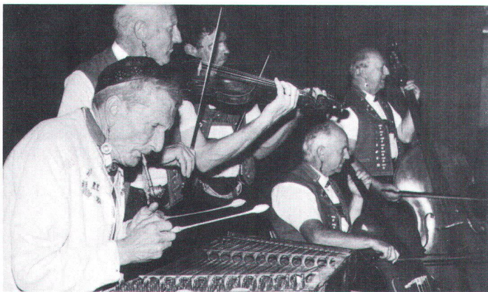
Die Streichmusik Alder aus Urnäsch spielt in Originalbesetzung.

L'orchestre à cordes Alder, d'Urnäsch, joue dans une formation originale.