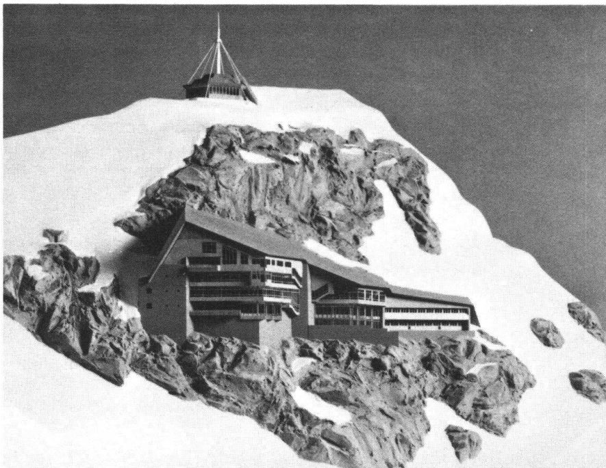
Maquette du projet Anderegg, recommandé par le jury, avec restaurant et terrasse panoramique, où l'ancien et le nouveau bâtiments sont reliés sans solution de continuité.

Jungfraujoch: succès d'un conseiller «Heimatschutz»