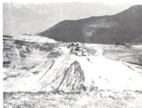
Maquette de l'aérodrome projeté au-dessus de Verbier (ci-dessus). Les travaux de construction (ci-dessous) ont été suspendus en attendant la décision du Tribunal fédéral.

gnes (août). Dans son préambule, ce recours invoque principalement le bruit, ainsi que le règlement de construction de la commune de Riddes , qui a pour but général de