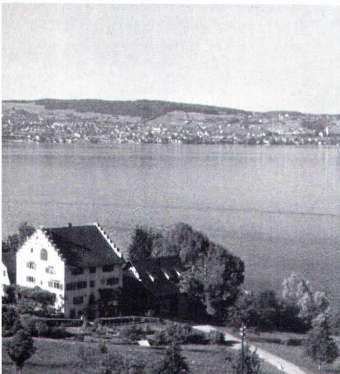
Le «Mülene» montre que, bien utilisés, des murs historiques ne sont pas forcément destinés à abriter un musée sans vie.