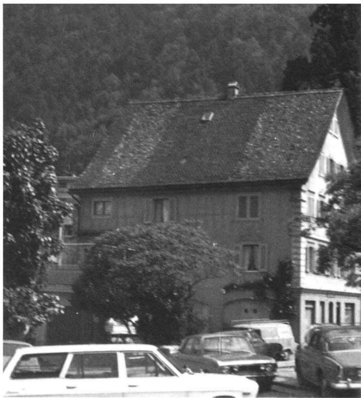
La «Lehnplatz» d'Altdorf; à l'arrière-plan, le groupe de séquoias illégalement abattu.

... Et pourtant nous vivons en un temps peu favorable aux arbres. Non seulement pour des raisons économiques (les forêts diminuent), mais aussi parce que notre temps est celui d'un extraordinaire gaspillage. Cela correspond à sa double tendance à la hâte et au nivellement: ce qui est élevé doit être abaissé, et l'âge perdre son prestige. L'arbre, par sa hauteur, est analogue au père, et avec lui tombent toutes les valeurs que symbolisait le père (Ernst Jünger).