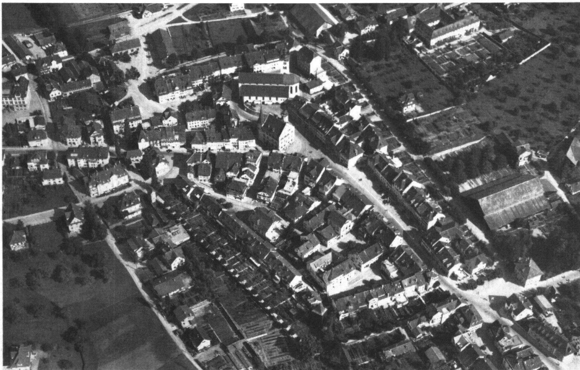
Sursee. Flugaufnahme der Stadt von 1946

Der geistigen Blüte des Stiftes um 1600 entsprach auch die künstlerische. Sehr hohe handwerkliche Qualität der einzelnen Bauteile anfangs 17. Jahrhundert: die Treppenanlage im Chor, das Chorgestühl, das Stiftergrabmal, die Gitter der Seitenschiffe sind Zeugnisse dafür. Nachdem die St.-Gallus-Kapelle eine frühbarocke Ausstattung erhalten hatte, wurde 1680 Kaplan Jeremias Schmid als Architekt mit der Barockisierung der ganzen Kirche beauftragt. Eine zweite Barockisierung (1773–1775) verwischte, was die Stukkierung und Ausstattung betrifft, die erste fast restlos. Sie gab der Stiftskirche