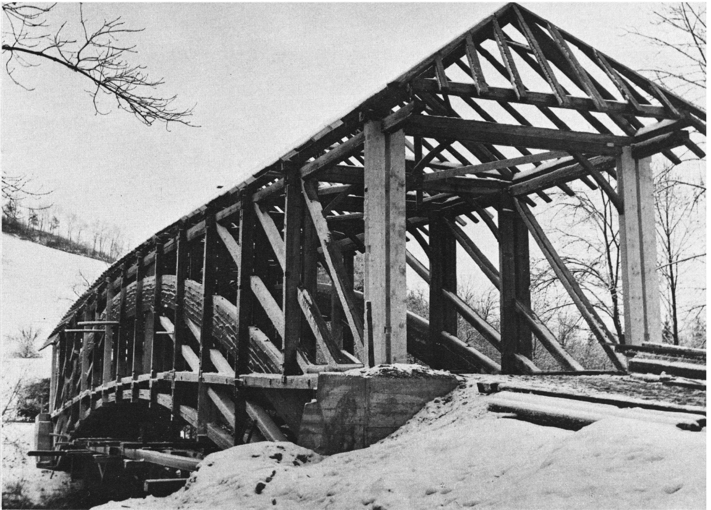
Reconstitution du pont de bois en arc de Hasle-Rüegsau, durant l'hiver 1957/58. Cet ouvrage, construit en 1839, franchit l'Emme d'une seule enjambée de 60 mètres environ.

Page 18 en haut: Des influences de l'antiquité marquent aussi l'architecture des ponts: ici, porte à colonnes doriques de l'ancien pont sur la Glatt d'Opfikon ZH, édifié en 1827 par Hans Caspar Stadler (démoli en 1935).