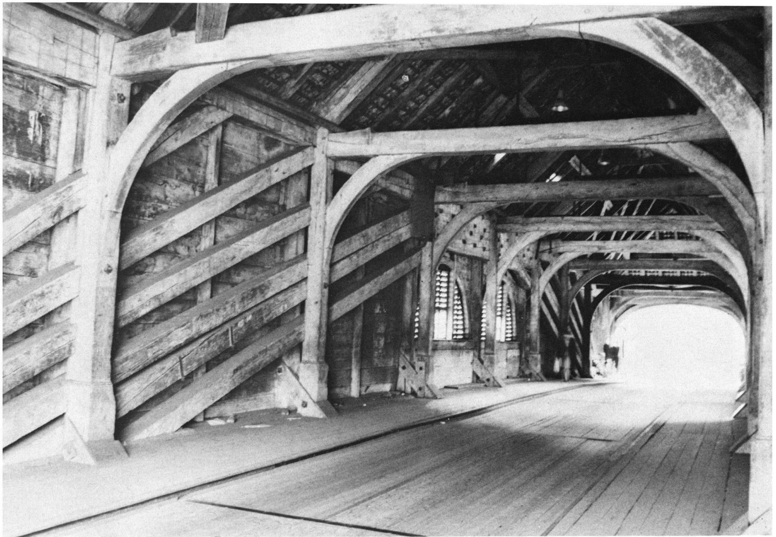
Suspension à contre-fiches du pont sur la Limmat, près du château baillival du Baden, construit en 1809 par Blasius Baltenschweiler. On voit, au milieu du pont, la réunion de plusieurs brides de liaison à adents.