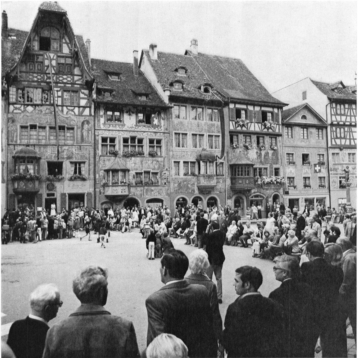
Der Rathausplatz von Stein am Rhein, im prachtvollen Rahmen seiner gleichermassen hablichen wie gepflegten, baukünstlerisch wertvollen Bürgerhäuser, war am vergangenen 17. August Schauplatz eines ungezwungenen kleinen Festes.

zu pflegen und auch die Umgebung weitgehend von störenden Eingriffen zu verschonen. Auch die Hauseigentümer haben das ihre dazu beigetragen; sie bekundeten aussergewöhnlichen Feinsinn für ihren Besitz und setzten dank ihrem Verantwortungsbewusstsein und Schönheitsempfinden bedeutende finanzielle Mittel für den stilgerechten Unterhalt der Bauten ein.