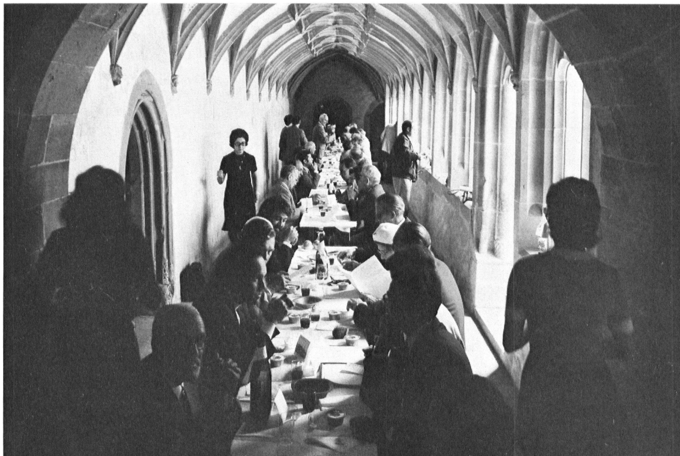
Nach dem Festakt vereinten sich die Gäste im Kreuzgang des Klosters St. Georgen bei einem Imbiss in froher Geselligkeit.