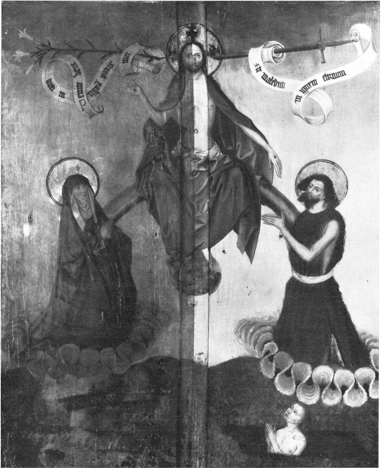
La composition principale, plaquée contre le mur, est restée inaperçue jusqu'à une date récente. Transportée à Zurich, cette œuvre saisissante fait l'objet des soins de l'Institut suisse pour l'étude de l'art. Notre photo a été prise alors que seule la moitié de droite avait été remise en état.