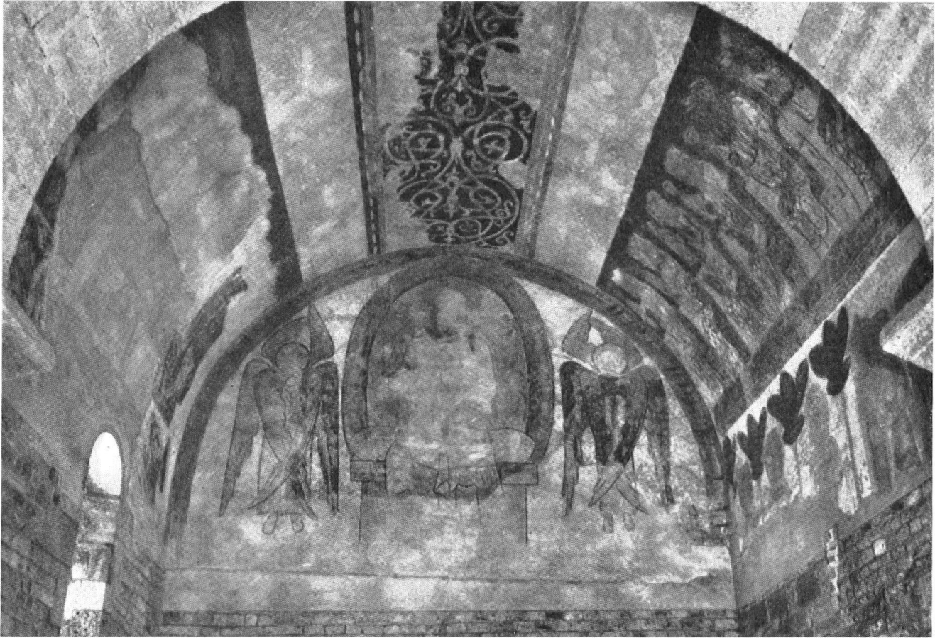
Das Erdgeschoß des Michaelsturms entspricht der Vorhalle der Kirche. Man hat darin Fresken entdeckt, die wahrscheinlich aus dem 12. Jahrhundert stammen, indessen leider stark beschädigt sind. Sie geben einerseits Christus als Weltenrichter, andererseits Engel und Greise im Rahmen einer Darstellung des Jüngsten Gerichts wieder.

Der Chor der Abteikirche erhält kunsthistorisch besonderes Gewicht durch zwei Reihen ebenso bemerkenswerter wie in ihrer Vielfalt den Betrachter überraschender Kapitelle. Die Kunsthistoriker, die sich um ihre Erforschung bemühten, vergleichen sie mit denjenigen, die in Cluny erhalten geblieben sind. Die Deutung der Bildwerke freilich hat sich zum Teil als sehr schwierig erwiesen. Die Bilder auf Seite 81 zeigen den Reichtum der künstlerischen Inspiration des Bildhauers von Payerne. Hier stellt er den Erzengel St. Michael dar (oben links), dort beschränkt er sich auf abstrakte Zierformen (oben rechts), andernorts wieder läßt er prachtvoll stilisierte Tiere und Pflanzen erscheinen.