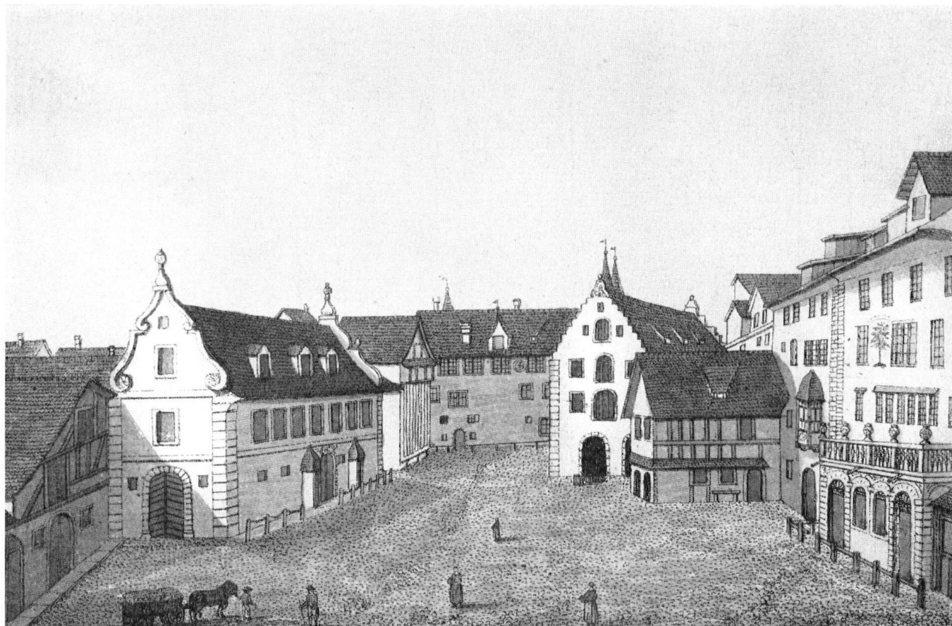
La place du Bohl vers 1780. Devant la Balance la maisonnette des chanteurs. Dessin de J. C. Mayr, gravure de H. Thomann.