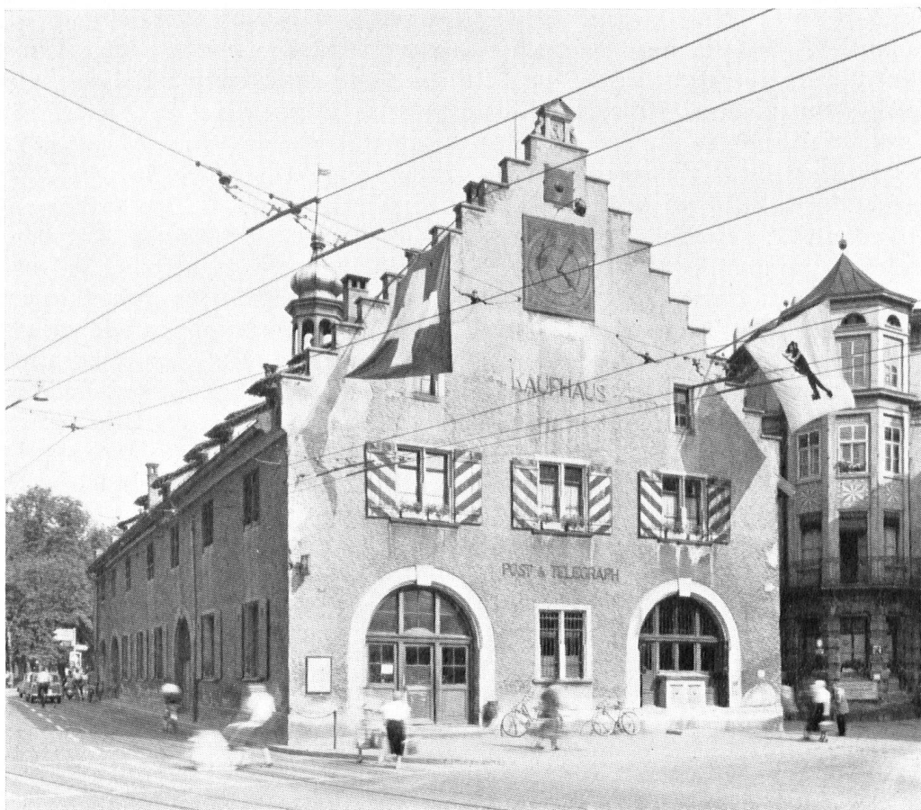
Façade ouest avant la restauration. Mauvaise structure architecturale. Au rez-de-chaussée quelques verrues. Crépi grisâtre et écaillé.