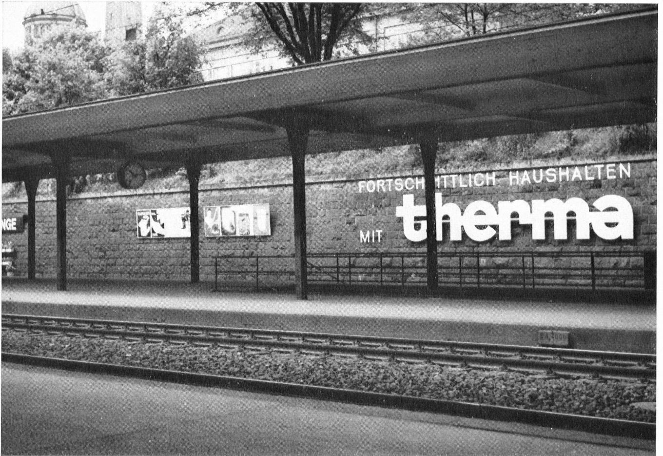
Station de Zurich-Enge. Therma est souvent interprété à tort par les Italiens comme synonyme de terminus. Si les C. F. F. s'arrogent le droit de placarder partout des réclames, les cantons et les communes pourraient s'aviser de les imiter.

Et voici les tableaux qui s'offrent au regard du voyageur arrivant à Bâle.