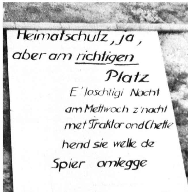
Images de la petite guerre des « blousons noirs » de Wetzwil contre un rural du temps de la bataille de Sempach, coupable de se trouver sur le tracé d'un projet de route. En haut: les effets de la première attaque et la belliqueuse pancarte.