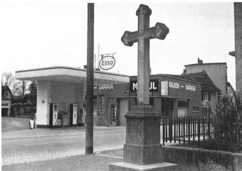
Drei Welten begegnen sich sogar an dieser Stelle! (Siehe vorbergehendes Bild.) Fast will uns scheinen, es wäre schicklich, wenigstens das alte Wegkreuz an einen stilleren Ort zu versetzen.

Die Schwere des Daches ist nur scheinbar, denn der breite Rand mit den Firmenfarben ist ein aufgestelltes Blechband.