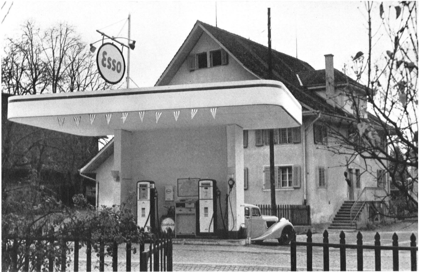
Zwei Welten! Theatralische Einzeltankstelle vor einem Inner-schweizer Bürgerhaus an der Straße Zürich-Luzern (Baar).

Die Schwere des Daches ist nur scheinbar, denn der breite Rand mit den Firmenfarben ist ein aufgestelltes Blechband.