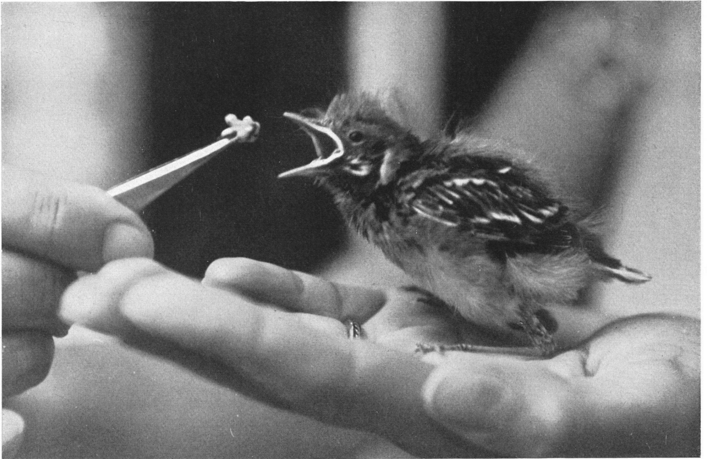
Statt der von einer Katze gefressenen Bachstelzenmutter reicht der Sempacher Vogelwart dem verlassenen Piepmatz nun die Nahrung.