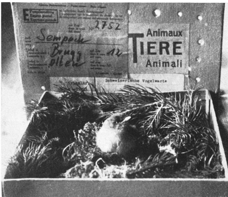
Sendung, wie sie zur Brutzeit fast täglich in die Vogelwarte kommen. Aus dem Nest gefallene Jungvögel, die sorgfältig aufgezogen und dann der Freiheit zurückgegeben werden.