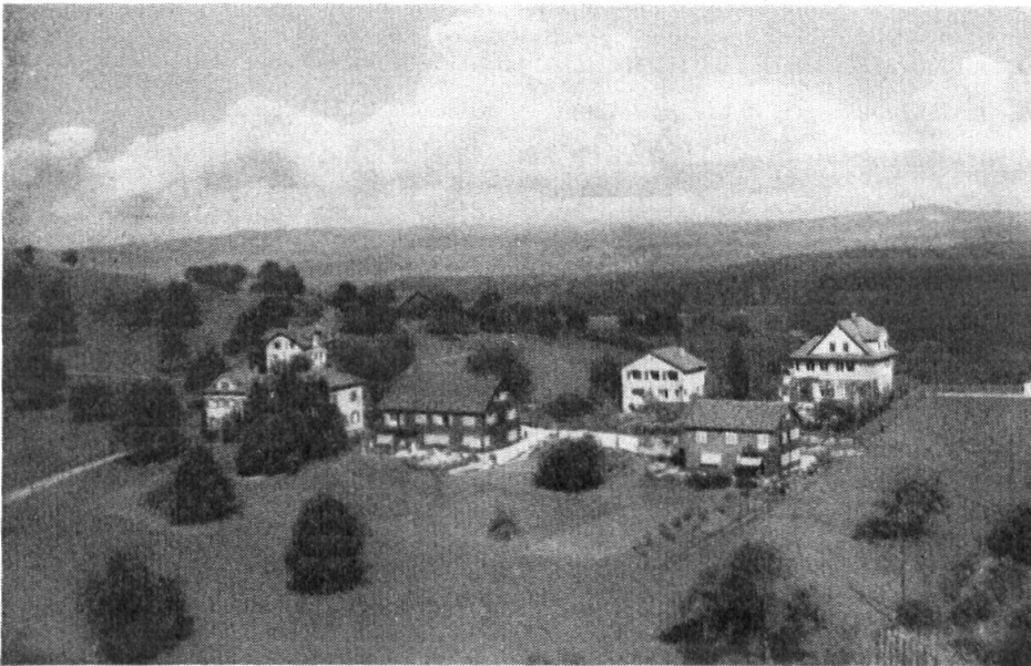
Arzthaus in Flawil, Kanton St. Gallen. Modernisiertes Riegelwerk, verschalt mit lackiertem Schindelschirm. Arch. F. Largiadèr, Riehen. Unten Arzthaus mit rechts Lehrerhaus von Arch. Zöllig, Flawil. Gärten durchgehend.