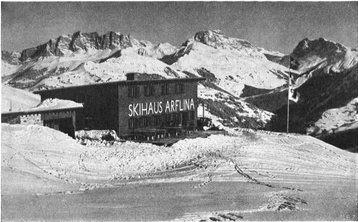
Skihaus Arflina in den Fideriser Heubergen, 1935. Skelettbau mit horizontaler Schalung. Bedachung Kupferblech. Einstöckiger Skiraum massiv. Rud. Christ, Arch. B. S. A., Basel. Cabane pour skieurs près de Fideris, Grisons. Construite en bois par R. Christ, architecte, Bâle. Couverte en tôle de cuivre. Le magasin pour les skis, à un étage, en pierre.

steins. Die Einführung des elektrischen Lichtes ist zwar eine allgemeine geworden, doch dürfen wir uns nicht verhehlen, dass gerade in den alten und enggebauten Gebirgsdörfern noch Schindeldächer mit hölzernen Kaminhüten und Holzherde vorhanden sind. Eine Wiederaufhebung der harten Bedachung für Neubauten wird deshalb in Anbetracht des Flugfeuers kaum durchdringen können. Hingegen wäre seit den Brandversuchen der LIGNUM die Wahl zwischen harter oder weicher, gegen Feuer imprägnierter Aussenhaut anzustreben, bei offener Bebauung sogar die gewöhnliche weiche Aussenhaut. Dementsprechend würde jeder Kanton in drei Zonen eingeteilt: 1. Stadtkerne mit Holzbauverbot; 2. Vorstädte mit Holzbauerlaubnis unter gewissen Bedingungen und 3. Dörfer- und Weiler mit Holzbau unter gewissen Bedingungen bzw. völliger Freiheit. Ueberall gleiche Abstände wie für Massivbau. Für Reihenhäuser werden Trennwände mit beidseitigen Holzwoolplatten an Stelle der nassen und unorganischen Brandmauern vorgeschlagen.