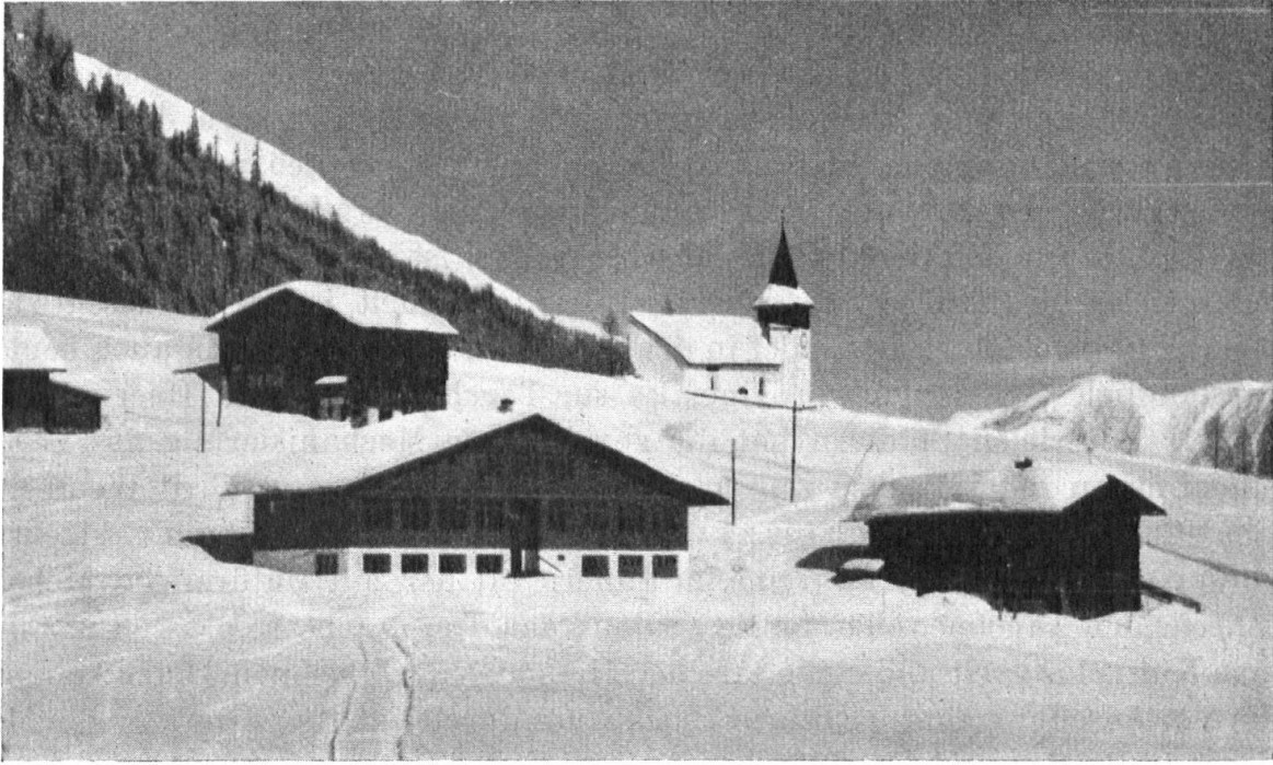
Neues Schulhaus in Davos-Frauenkirch. Skelettbau mit Schalung mit lackiertem Schindelschirm. Im massiven Untergeschoss Turnsaal und Duschen. Rud. Gaberel, Arch. B.S.A., Davos. Rechts das alte, trostlose, um 1900 gebaute Schulhaus.

La nouvelle école à Davos-Frauenkirch, construite en 1936 par R. Gaberel, architecte, Davos. Le sous-sol, construit en pierre, contient la salle de gymnastique et les douches. A droite la vieille école, construite vers 1900 sans aucun sens pour ce qui convient au paysage.