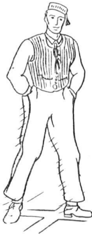
Tanzschenk um 1880 von M. Gyr.

14. Der Tanzschenk. An der Kirchweih spielte auf der Tanzdiele der Gasthäuser (früher auf dem Rathaus) bis in die 80er Jahre der Tanzschenk eine besondere