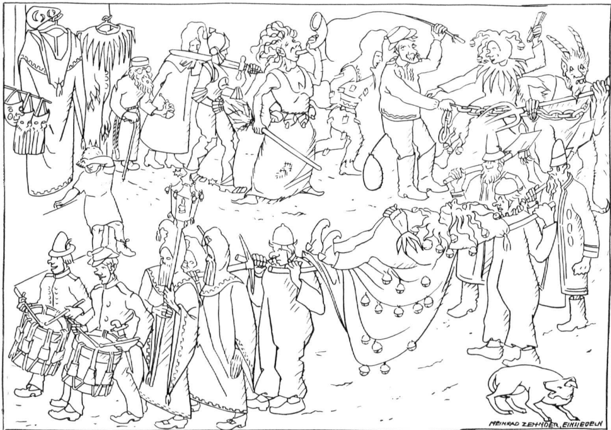
Zur Ordnung beim Begraben des Pagats (Rekonstruktion von M. Gyr)