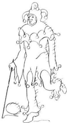
Der Hörelibajass des letzten Jahrhunderts. Skizzi v. M. Gyr.