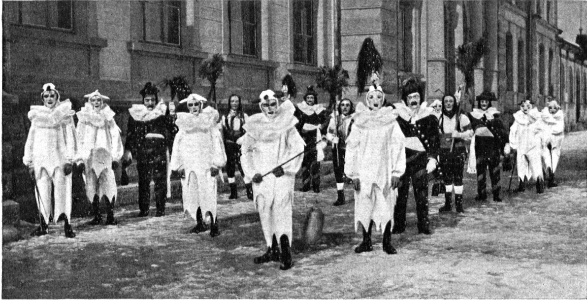
Bajassen, Joheen und Mummerien besammeln sich zur Zugsordnung.

NACHDRUCK DER AUFSÄTZE UND MITTEILUNGEN BEI DEUTLICHER QUELLENANGABE ERWÜNSCHT