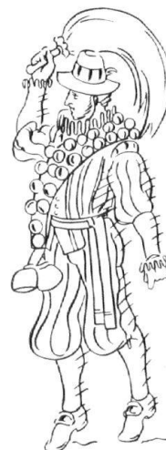
Mummerie d. 17. Jahrhunderts. Skizze v. M. Gyr.

abgetragenen Kleidern der 1870er Alltagsmode. 4. Der betrunkene Fuhrmann mit grossem Filzhut in eine Spitze gedrückt, nach der Art der Fecker oder Altmatter Fuhrleute, hellblauer Bluse und kurzen Rohrstiefeln. 5. Der Hörelibajass in weisser Haube, Jacke und Hose mit breiten Dreieckspitzen, an denen kleine Messingröleli hängen. An der Haube wackeln drei plumpe Höreli aus rotem Stoff, an denen ebenfalls Röleli hängen. Er trägt eine weisse Narrenlarve und schwingt eine Schweinsblase an einem Stecken. Er ist wahrscheinlich eine unserer ältesten Masken (mythologisch). Er muss sich durch neckische Bocksprünge hervortun. 6. Der Näpeler, ein ausgedienter Soldat aus neapolitanischen Diensten oder aus der französischen Legion in nachlässig getragener alter Montur. 7. Der Altvater, eine harmlose Bühnenfigur, Fassung Rokoko, mit einer langen Tabakpfeife im Mund. Er knüpft da und dort mit Bekannten ein ratspendendes Gespräch an und drückt sich dann geräuschlos. 8. Der Ritter, Fassung 17. Jahrhundert, der aus städtischen Verhältnissen, d. h. aus dem Züribiet heraufgekommen sein muss. Ein toller Brauch, der aber in den 70er Jahren aus einleuchtenden Gründen verboten wurde, war, sich an der Fastnacht in braunen Kapuziner- und schwarzen Waldbruderkutten zu belustigen. An der Herrenfastnacht erscheinen die Sühudi von neuem.