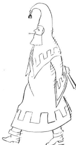
Der Domino aus Persiane des letzten Jahrhunderts. Skizze v. M. Gyr.