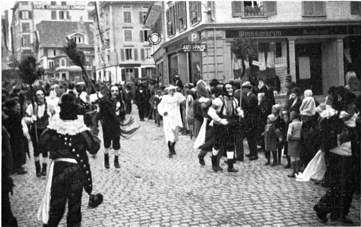
Die Gangart auf der Strasse.