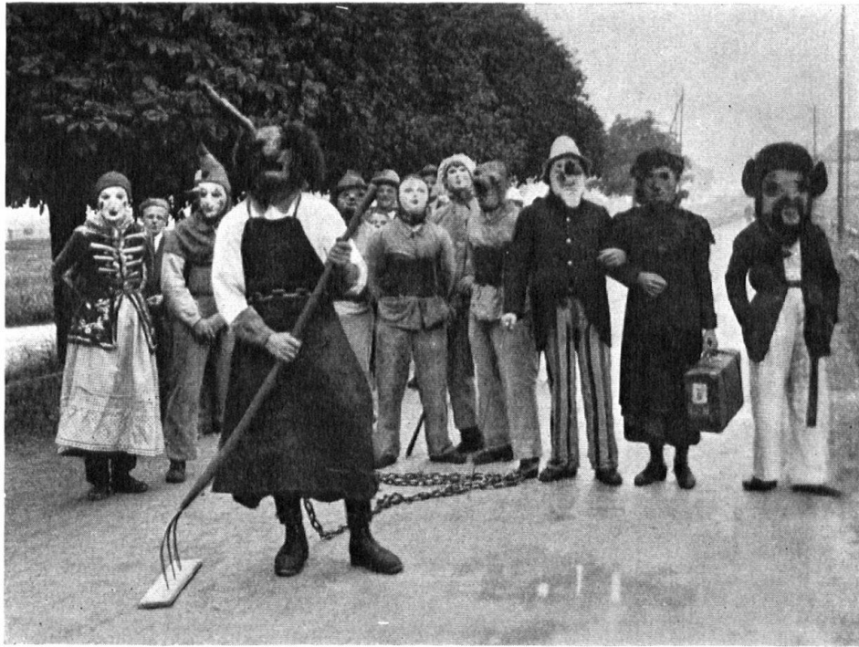
Eine Gruppe Sühudi.